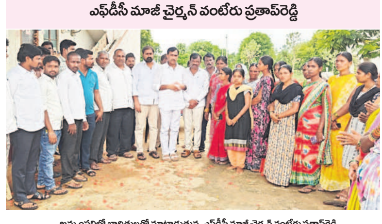
ఖమ్మంపల్లిలో బాధితులతో మాట్లాడుతున్న ఎఫ్డీసీ మాజీ చైర్మన్ వంటేరు ప్రతాపరెడ్డి

కొండపాక (కుతుబూరుపల్లి), జూన్ 27 : కొండపాక మండలంలోని ఖమ్మంపల్లిలో నిర్మించిన డబుల్ బెడ్ రూమ్ ఇండ్లను నిర్వహించే లక్ష్యాన్ని అధికారులు అందజేయాలని గణేష్ నియోజమావర్తం బీఆర్ఎస్ ఇన్ ఛార్జ్, ఎఫ్డీసీ మాజీ చైర్మన్ వంటేరు ప్రతాపరెడ్డి డిమాండ్ చేశారు. కాంగ్రెస్ ప్రభుత్వం మూర్ఖత్వం ఆలోచనలతో, అధికార బలంతో రెవెన్యూ, పోలీస్ సిబ్బందిని అడ్డుపెట్టుకొని 19 నిరుపేద కుటుంబాలను డబుల్ బెడ్ రూమ్ ఇండ్ల నుంచి గెంటివేసి ఇండ్లకు తాళాలు వేయడం హెచ్చరించారు. గురువారం ఖమ్మంపల్లిలోని డబుల్ బెడ్ రూమ్ ఇండ్లను ప్రతాపరెడ్డి సందర్శించడంతో పాటు బాధితుల కుటుంబాలను ఓదార్చారు. అనంతరం ఆయన మాట్లాడుతూ కేసీఆర్ ప్రభుత్వం హయాంలో ఖమ్మంపల్లిలో నిరుపేదల కోసం 60