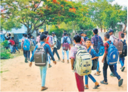
లింగంపేటలో పాఠశాల నుంచి ఇంటికే వెళ్తున్న విద్యార్థులు

ఎల్లారెడ్డి/ గాంధారి/ లింగంపేట/మాచారెడ్డి/భిక్కనూరు/బాన్సువాడ టౌన్/బిమ్మండ, జూన్ 26: ఏబీవీపీ పిలుపు మేరకు ఎల్లారెడ్డి, గాంధారి, లింగంపేట, మాచారెడ్డి, భిక్కనూరు, బాన్సువాడ, బిమ్మండలోని అన్ని ప్రభుత్వ ప్రైవేటు పాఠశాలలు బుధవారం బండ్ల ప్రశాంతం చేయించారు. పలు పాఠశాలలు ముందుగానే సెలవు ప్రకటించడంతో విద్యార్థులు ఇండ్లకే పరిమితం అయ్యారు. ప్రభుత్వ పాఠశాలలు, విద్యార్థుల సమస్యలను పరిష్కరించేవరకు పోటాటు కొనసాగిస్తామని ఏబీవీపీ నాయకులు పేర్కొన్నారు.