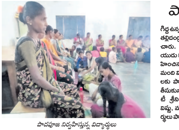
పాదపూజ నిర్వహిస్తున్న విద్యార్థులు