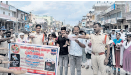
బిమ్మండలో కాలేజీ విద్యార్థులతో ప్రతిజ్ఞ చేయిస్తున్న పోలీసు అధికారులు