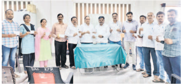
టీఎస్పీఎస్ సభ్యత్వం తీసుకుంటున్న ఉద్యోగులు