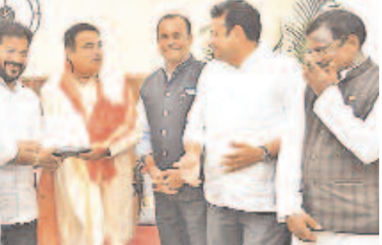
డిల్లీలో బుద్ధవారం కేంద్రమంత్రి నితిన గడ్కరీ కలిసిన సీఎం రేవంత్ రెడ్డి. విజయవాడలో మంత్రిలు భట్టి విక్రమార్క, శ్రీధర్ బాబు, కోమటిరెడ్డి తరించారు

కృష్ణా, గోదావరి జలాల తరలింపు సంక్లిష్టం గోదారి నుంచి వస్తున్నది 13.3 కోట్ల గ్యాలన్ల ప్రస్తుతం రోజుకు 3.9 కోట్ల గ్యాలన్ల కొరత కృష్ణా నుంచి 90 ఎంజీటిల సరఫరా బండ్ ప్రజలకు అవుతున్న సమాధానమే వినిపిస్తున్నది. ప్రస్తుతం అటు కృష్ణా, ఇటు గోదావరి నుంచి అత్యవసర మోకాళ్లతో నీటిని తరలిస్తున్న జల మండలి.. ఇప్పుడు వరుణుడి కరుణ కోసం కనీసం అవకాశం ఉన్నది. రైతులతోపాటు కొలు రైతులకు కూడా ఎకరాకు ఏడాదికి రూ.15 వేల చొప్పున పెట్టుబడి సాయం అందజేస్తామని కాంగ్రెస్ పార్టీ మ్యూనిసిపాలిటీలో మేర్పాటుచేసింది. అయితే, కొలు రైతులను ఏ విధంగా గుర్తించాలనేది పెద్ద ప్రశ్నగా మారింది. రాష్ట్రంలో సుమారు 70 లక్షల మంది రైతులు ఉండగా, కొలు రైతులు > 10వ పేజీలో