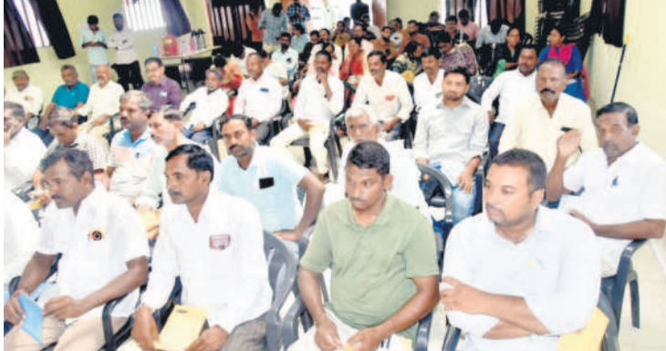
తిమ్మాపూర్ : తిమ్మాపూర్ రైతు వేదికలో వీడియో కాన్ఫరెన్స్ లో పాల్గొన్న రైతులు