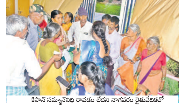
కిసాన్ సమ్యాన్ నిధి రావడం లేదని నాగవరం రైతువేదికలో

వసపర్తి, జూన్ 25 (నమస్తే తెలంగాణ) : రైతు బంధు మంత్రివర్గ సభకమిటీ వేసిన కాంగ్రెస్ ప్రభుత్వం రైతుల నుంచి కూడా అభిప్రాయాల సేకరించాలని నిర్ణయించింది. ఈ మేరకు మంగళవారం నాగవరం రైతు సేవల కమిటీ భాగంగా డిడియో కాన్ఫరెన్స్ ద్వారా రైతులకు ప్రాసెస్ ఇయ్యడం వ్యవసాయ విశ్వవిద్యాలయం శాస్త్రవేత్తలతో అవగాహన కార్యక్రమం నిర్వహించారు. గద్వాల నియోజకవర్గానికి సంబంధించి మల్లకల్ రైతు వేదికలో నిర్వహించిన కార్యక్రమంలో గద్వాల నియోజకవర్గంలోని ఐదు మండలాల రైతులతోపాటు వ్యవసాయశాఖ అధికారులు పాల్గొన్నారు. రైతు సేవల కమిటీ భాగంగా వాసకాలం రైతు భరోసాను సంబంధించి రైతుల నుంచి ప్రభుత్వం సూచనలు తీసుకోవాలి. ఈ సమావేశంలో పాల్గొన్న రైతులను 'నమస్తే తెలంగాణ' పలకరించగా కింది విధంగా మాట్లాడారు.