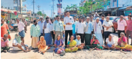
అయిజల్ పాత పింఛన్లందరికీ రాష్ట్రాధికారం చేస్తున్న అభిదారులు

● అయిజల్ ఆసరా లబ్ధిదారుల రాష్ట్రాధికారం ● పాత పింఛన్ నెలనెలా ఇవ్వడం లేదని ఆవేదన అయిజల్, జూన్ 25 : కాంగ్రెస్ ప్రభుత్వం అధికారంలోకి వచ్చిన వెంటనే రూ.రెండు వేలు ఉన్న పింఛన్ ను నాలుగు వేలు, దివ్యాంగుల పింఛన్ ను రూ.ఆరువేలు చేస్తామని అసెంబ్లీ ఎన్నికల్లో హామీ ఇచ్చిన రేవంత్ రెడ్డి సర్కారు విద్యార్థులు చేసే విడుదలలను కాపాడుతూ వాటిని ఎత్తడం లేదని అభిదారులు ఆందోళన వ్యక్తం చేశారు. కేసీఆర్ హయాంలో నెలనెలా మొదటి వారంలోనే పింఛన్లు వచ్చేవని, కాంగ్రెస్ సర్కార్ పొందగా నెల ముగిస్తున్నా పింఛన్లు వచ్చడంలేదని ఆరోపించారు. పింఛన్ పెంచడం లేదని దేవుడుగల పాత పింఛన్లు అయినా నెలనెలా ఇవ్వాలని అభిదారులు డిమాండ్ చేశారు. మంగళవారం అయిజల్ పట్టణంలోని పాత బస్ స్టాండ్ సమీపంలో అయిజల్, గద్వాల రహదారిపై పింఛన్ల పెంపు, నెలనెలా పింఛన్లు ఇవ్వడం లేదని ఆసరా అభిదారులు రాష్ట్రాధికారం చేపట్టారు. ఈ సందర్భంగా వారు మాట్లాడుతూ పింఛన్ రేవంత్ రెడ్డి ఆసరా పింఛన్లు డబ్బులే చేస్తామని ఎన్నికల సమయంలో హామీ ఇచ్చాడని, ఎన్నికల్లో గెలుపొంది ఏడు నెలలు కాపాడుతూ పింఛన్లు మాట నిలబెట్టకపోవడం లేదని ఆరోపించారు.