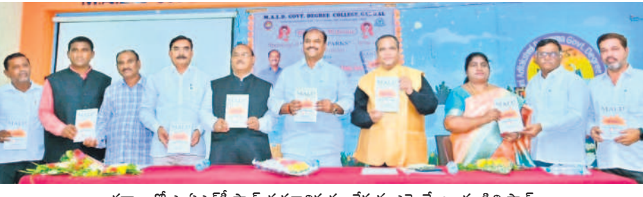
గద్వాలలో ఎంపిఎల్డీ స్పార్క్ ప్రకృతివనం ప్రాజెక్టును ప్రారంభించిన సందర్భంగా