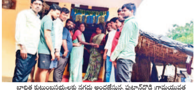
బాధిత కుటుంబసభ్యులకు సగటు అందజేస్తున్న పుటాన్ దొడ్డి గ్రామయువత