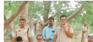
గోపాల్ పేట మండలంలో..

అలవర్చుకోవాలన్నారు. అనంతరం డ్రగ్స్, మాదక ద్రవ్యాల వల్ల కలిగే అనర్థాలపై విద్యార్థులకు వ్యాసరచన పోటీలు నిర్వహించారు. కార్యక్రమంలో పాన్ గల్, డివిజన్, ఉపాధ్యాయుడు శ్రీనివాసలు తదితరులు ఉన్నారు.