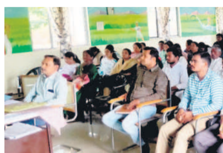
సారంగాపూర్ : వీడియో కాన్ఫరెన్స్ పాల్గొన్న రైతులు, అధికారులు

కుంటూరు, జూన్ 25 : రైతు భరోసా కింద అందించే సాయం 10 ఎకరాల వరకు ఇవ్వాలని, సమయానికి అందించాలని మంత్రి తుమ్మల నాగేశ్వర్ రావు వీడియో కాన్ఫరెన్స్ నిర్వహించారు.