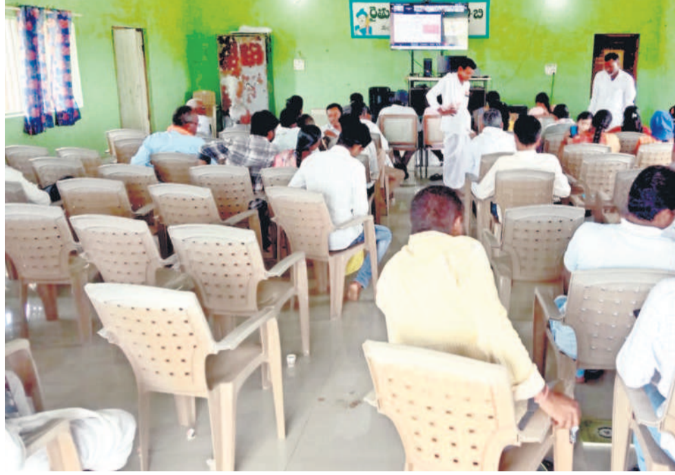
ఇంద్రవెల్లిలో నిర్వహించిన అభిప్రాయ సేకరణలో రైతులు రాకపోవడంతో ఖాళీగా దర్శనమిస్తున్న కుర్చీలు

కాన్ఫరెన్స్ (పీసీ)లు ఏర్పాటు చేశారు. అన్ని పీడియో కాన్ఫరెన్సులు కూడా నామమాత్రంగా కొనసాగాయి. జైన్ బోర్డ్ నిర్వహించిన పీసీ జైన్ బోర్డ్, బేల, ఆదిలాబాద్ అర్బన్, ఆదిలాబాద్ రూరల్, మావల మండలాలకు చెందిన రైతులు హాజరుకావాల్సి ఉండగా జైన్ బోర్డ్, బేల మండలం రైతులు మాత్రమే కనిపించారు. ఇంద్రవెల్లిలో నిర్వహించిన పీసీలో ఇంద్రవెల్లి, ఉట్కర్, నార్కట్ పల్లి మండలాలకు చెందిన రైతులు పాల్గొనాల్సి ఉండగా.. ఇంద్రవెల్లి రైతులు ఉన్నారు. బోర్డ్ నిర్వహించిన కాన్ఫరెన్సులలో బోర్డ్, బజార్ మాత్పూర్, నేరడిగొండ మండలాల రైతుల హాజరుకావాల్సి ఉండగా.. కేవలం స్థానిక రైతులు కనిపించారు. ఇన్స్పెక్టర్ నిర్వహించిన పీసీలో ఇన్స్పెక్టర్, గుడిమాత్పూర్, సిరికొండ, తాంపి, తలమడుగు, భీంపూర్ మండలాల రైతులు రావాల్సి ఉండగా చుట్టు పక్కల రెండు మండలాల రైతులు వచ్చారు. వ్యవసాయశాఖ అధికారులు, సిబ్బంది ఎక్కువ సంఖ్యలో హాజరున్నారు. పీడియో కాన్ఫరెన్సులో రైతులు సుంచి సలహాలు, సూచనలు సేకరించాల్సి ఉండగా.. ప్రతి నియోజకవర్గంలో ఒక్కో రైతుకు మాత్రమే మాట్లాడే అవకాశం కల్పించారు. ఇన్స్పెక్టర్ అసలు మాట్లాడే అవకాశం రాలేదు. దీంతో అక్కడి వచ్చిన అన్నదాతలు ఆగ్రహం వ్యక్తం చేశారు.