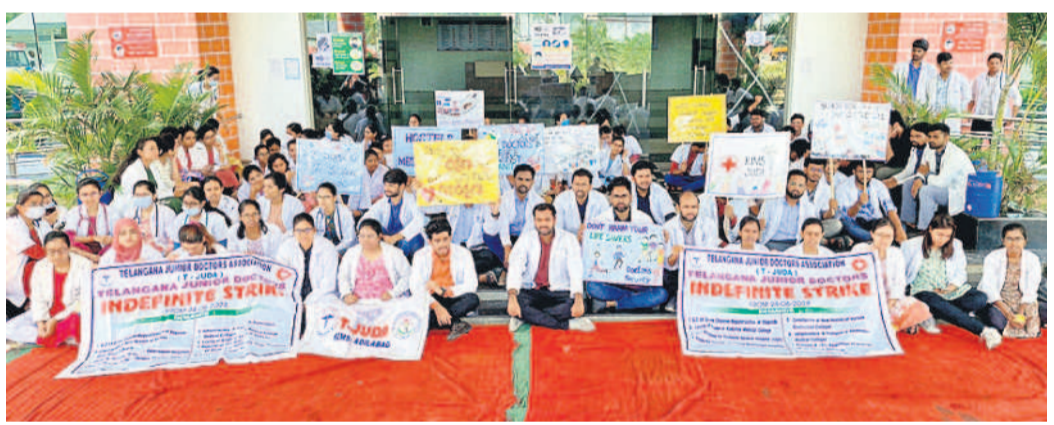
రిమ్మి సూపర్ స్టోరులో దళాభిమాన ఎదుట జూనియర్ వైద్యుల ఆందోళన