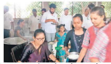
విద్యార్థులతో కలిసి భోజనం చేస్తున్న ఎమ్మెల్యే