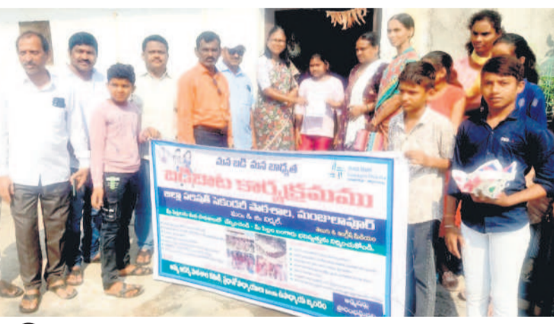
బడిబాల్ నిర్వహిస్తున్న ఉపాధ్యాయులు