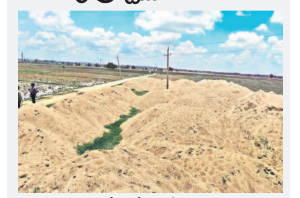
బోర్లంలో డంప్ చేసిన ఇసుక