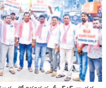
జగిత్యాలలో ఘోషారాజ్ నిరసనను బీఆర్ఎస్ నాయకులు