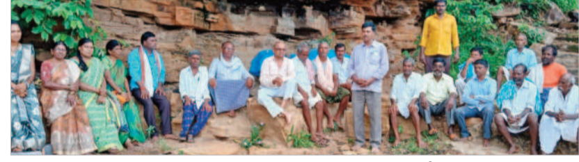
అప్రూబాద్ అంతర్గంగా దేవాలయ సూతన కమిటీ