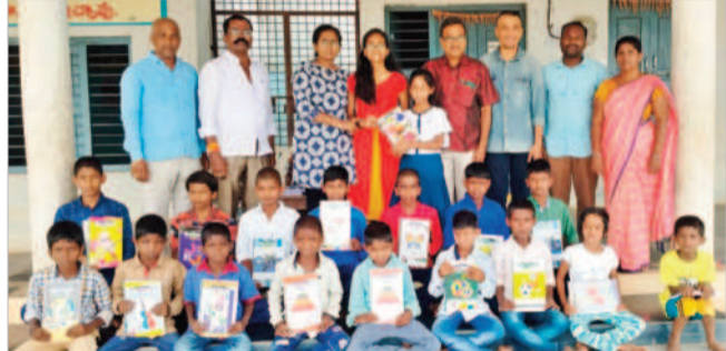
విద్యార్థులకు నోట్ బుక్స్ అందజేస్తున్న సభ్యులు

అచ్చంపేట టౌన్, జూన్ 23 : అచ్చంపేట పట్టణంలోని వనవాసీ సేవా ప్రభుత్వ బాలుర హాస్టల్లో విద్యార్థులకు ఉపకరణాల నోట్ బుక్స్ పంపిణీ చేశారు. నాగర్ కర్నూల్ కు చెందిన ఆపరేషన్ స్ట్రెట్ టీం సభ్యులు ముఖ్యమంత్రి శ్రీజీ పట్టణంలోని శ్రీ సత్యలక్ష్మి శిశుమందిర్ పాఠశాలను సందర్శించి, ఆ పాఠశాలకు అనుబంధంగా నడుస్తున్న వనవాసీ సేవా ప్రభుత్వ బాలుర హాస్టల్ ను పరి