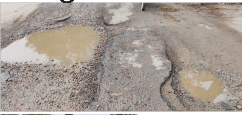
చారకొండలో గుంతలమయంగా ఉన్న రహదారి

మల్రపల్లి వద్ద అధ్వానంగా మారిన రహదారి. చారకొండ, జూన్ 23: మోకాల్లో గుంతలు, రాళ్లు తేలి.. రూపురేఖలు కోల్పోయిన రహదారిపై గమ్యస్థానాలకు చేరుకోవాలంటే గగనమే.. నిత్యం ప్రమాదాలతో ప్రాణనశంకల మారడంతో ప్రజలు ఆందోళన చెందుతున్నారు. మండల కేంద్రంలో కోదాడ-జడ్చర్ల జాతీయ రహదారిలో భాగంగా మల్రపల్లి నుంచి చారకొండ వరకు బైపాస్ రోడ్డు నిర్మిస్తున్నారు. జాతీయ రహదారి