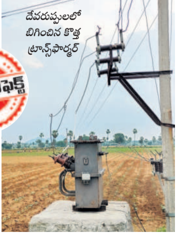
దేవరపుల్లలో బిగించిన కొత్త ట్రాన్స్ ఫార్మర్