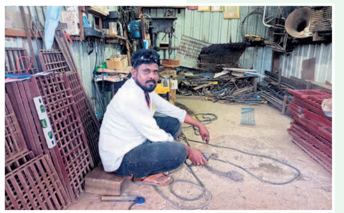
2014కు ముందు చేతినిండా పనిలేదు

కమలాపూర్ : తెలంగాణ రాష్ట్రం కరోట్ ఎప్పుడొస్తాడో ఎప్పుడు పోతదో తెలియక పోయేది. పనులు చేయలేక తీవ్ర ఇబ్బందులు పడ్డం. రెండు, మూడు గంటలు ఇచ్చే కరోట్తో వెళ్లింగి పనులు కుంటుపడ్డాయి. కేసీఆర్ వచ్చినంత 24 గంటల రియాలిటీ చేతినిండా పనిదొరికినా పాటు ఒకరికీ ఉపాధి కల్పిస్తున్న పదిగ్రామాలలో చిన్న చిన్న వెల్డర్లు కూడా ఉన్నారు. కరోట్ ఉంటేనే మాపని అవుతుంది. లేకుంటే ఖాళీగా ఉండాలి వస్తది. 2014కు ముందు, ఇప్పుడు కాంగ్రెస్ సర్కార్ ఉన్నది. మళ్ళీ కరోట్ కోతలు ఉంటాయని భయమైతాంది. కరోట్ ఇచ్చిన కేసీఆర్ పై కాంగ్రెస్ ప్రభుత్వం ఇష్టమిచ్చినట్లు మాట్లాడడం సిగ్గుచేటు.