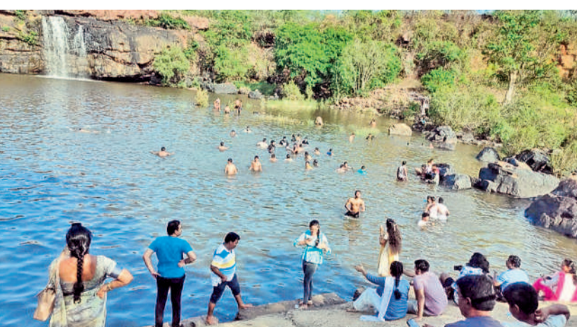
రక్షణ కంచె లేకపోవడంతో జలపాతంలోకి దిగి ఈత కొడుతున్న పర్యాటకులు

బోగత జలపాతాన్ని వీక్షించేందుకు ఆదివారం రాష్ట్రంలోని నలుమూలల నుంచి పెద్ద ఎత్తున పర్యాటకులు తరలివచ్చారు. జలపాతం ముందు భాగంలో ఉన్న నీటిలో దిగి న్నానాలు చేస్తూ ఈతలు కొడుతూ సందడి చేశారు.