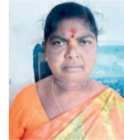
- మణెక్క చిరు వ్యాపారి, పెరుకవాడ, చరంగల్

గిర్రాజిపేట : 2014కు ముందు కరోట్ లేక చిన్న వ్యాపారులు చేసుకునేటోళ్లుకు మన్న కష్టం గ ఉండేది. ఎప్పుడు అక్కడో, ఎప్పుడు పోతదో తెలక ఇబ్బందులు పడేటోళ్లు. కరోట్ సక్రమ ఇయ్యకపోవడంతో గిర్రాజి అచ్చేది కాదు. పూట గడవడం కూడా కష్టంగా ఉండేది. తెలంగాణ అల్లి, కేసీఆర్ ముఖ్యమంత్రి అయినంత అందరు మందిగిర్రాజిని 24 గంటల కరోట్ ఇచ్చింది. మూలాంటి చిన్న వ్యాపారుల చేసుకునేటోళ్లుకు గిర్రాజి పెరుగుడుతోటి కుటుంబాలు మంచిగెనయే. సంతోషంగా బతికిండ్రు. మళ్ళా ఇప్పుడు కాంగ్రెస్ అల్లి అచ్చినంత కష్టాలు మొదలైయ్యే. చెప్పకుండా కోతలు పెడుతుంటే ఇబ్బందులు పడుతున్నం. కేసీఆర్ సారూ ఎత్తు కొన్నట్లో కానీ కరోట్ మంచిగిచ్చిండ్రు. విద్యుత్ సమస్యలేకుండా తెలంగాణ తలరాతను మార్చిన కేసీఆర్ పై నిండలేయడం సరికాదు.