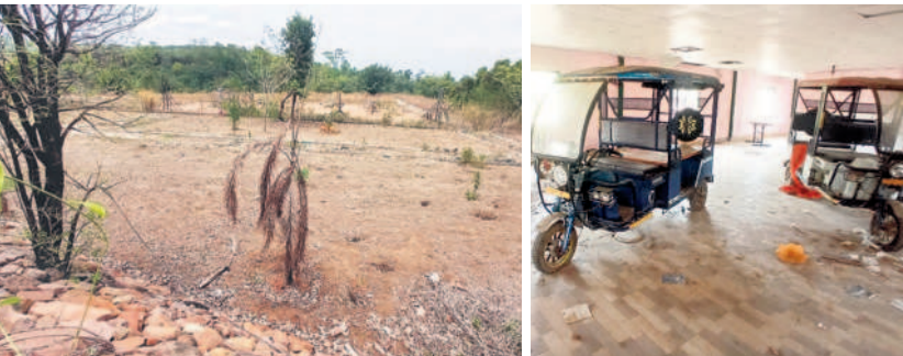
పిచ్చిమొక్కలతో అధ్వానంగా చిల్డ్రన్ పార్క్ మూలనపడ్డ బ్యాటరీ ఆటోలు