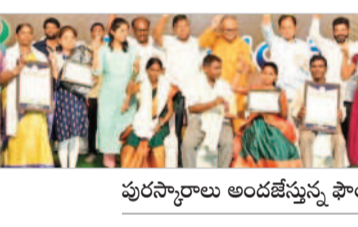
పురస్కారాలు అందజేస్తున్న ఫౌండేషన్ సభ్యులు