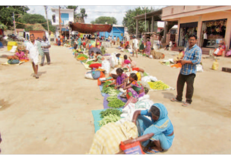
రోడ్డుపైన కూర్గాయలు వికల్పస్థున్న వ్యాపారులు