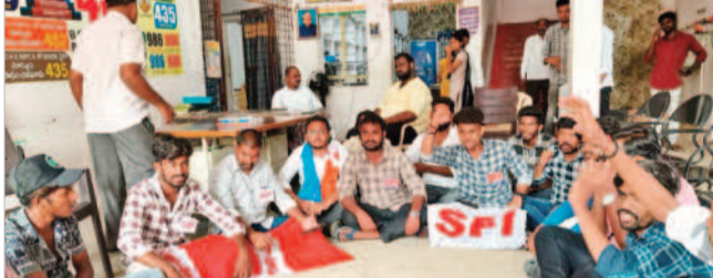
ఓ. ప్రైవేట్ కళాశాల వద్ద అందోళన చేస్తున్న విద్యార్థి సంఘాల నాయకులు