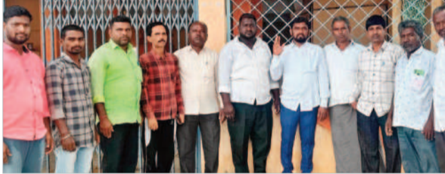
మాట్లాడుతున్న అంబేద్కర్ సంఘం, అఖిలపక్ష నాయకులు