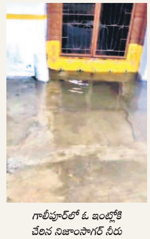
గాలిపూర్లో ఓ ఇంట్లోకి చేరిన నిజాంసాగర్ నీరు