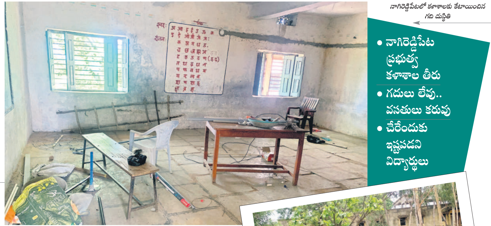
నాగిరెడ్డిపేటలో కళాశాలకు కేటాయించిన గది దుస్థితి