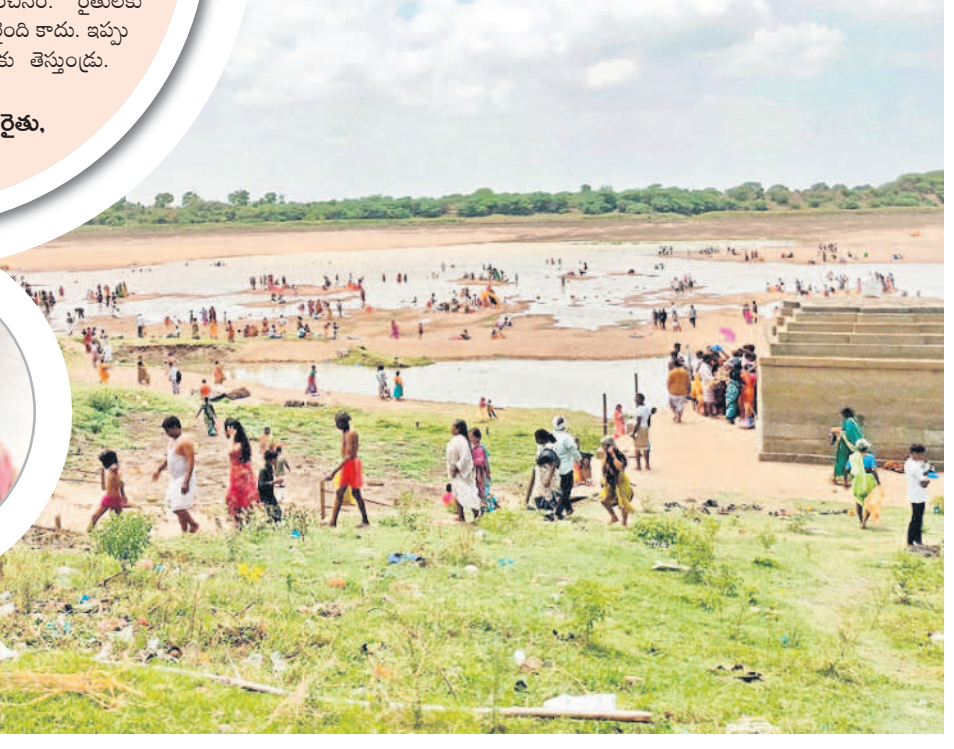
- రెంజిల్, జూన్ 23

రెంజిల్ మండలం కండ్లకర్తి సమీపంలోని గోదావరిలో ఆదివారం భక్తులు పుణ్యస్నానాలు ఆచరించారు. ఆరుద్ర పర్వదినం పురస్కరించుకొని భక్తులు పెద్ద సంఖ్యలో గోదావరికి చేరుకున్నారు. ఇటీవల నదిలో కొత్తనీరు చేరడంతో తెప్పలను వదిలి మొక్కులు వెల్లిండుకున్నారు. నదిలోని పురాతన శివాలయాన్ని దర్శించుకొని భక్తులు ప్రత్యేక పూజలు చేశారు.