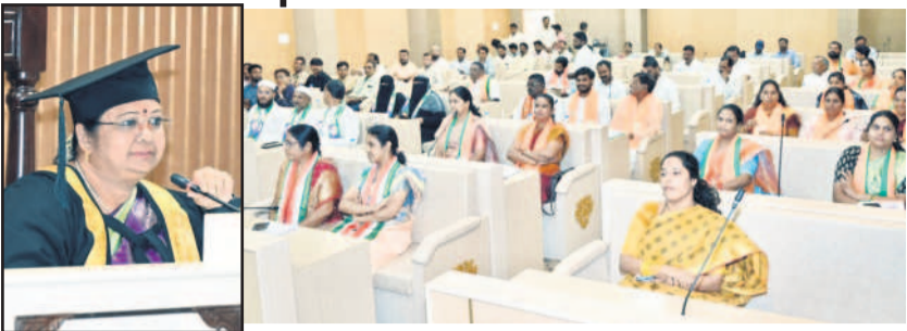
సమావేశంలో మాట్లాడుతున్న మేయర్ సీతాకిరణ్, హాజరైన ప్రజాప్రతినిధులు, కార్పొరేటర్లు, అధికారులు

ఖలీల్‌వాడి, జూన్ 22 : నగర మున్సిపల్ కార్పొరేషన్ పరిధిలో ఉన్న 60 డివిజన్లలో అభివృద్ధి పనులకు రూ. 6 కోట్లు కేటాయించామని నగర మేయర్ దండం సీతాకిరణ్ తెలిపారు. జిల్లాకేంద్రంలోని మున్సిపల్ కార్యాలయంలో కౌన్సిల్ సమావేశాన్ని శనివారం నిర్వహించారు. ఈ సందర్భంగా ఆమె మాట్లాడుతూ.. కార్పొరేటర్లు వారి పరిధిలో ఉన్న సమస్యలను సమావేశంలో వివరించాలని, వాటిని వీలైనంత త్వరగా పరిష్కరించే దిశగా మున్సిపల్ శాఖ పని చేస్తుందని తెలిపారు. నగరంలోని ఒక్కో డివిజన్లో అభివృద్ధి పనులకు రూ. 10 లక్షల చొప్పున మొత్తం రూ. 6 కోట్లు కేటాయించినట్లు తెలిపారు. మున్సిపల్ కార్పొరేటరు వేతనాల విషయంలో చర్చించామని అన్నారు.