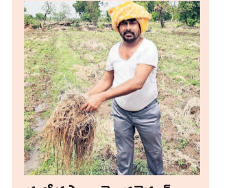
మళ్లీ కష్టాలు మొదలైనయో..