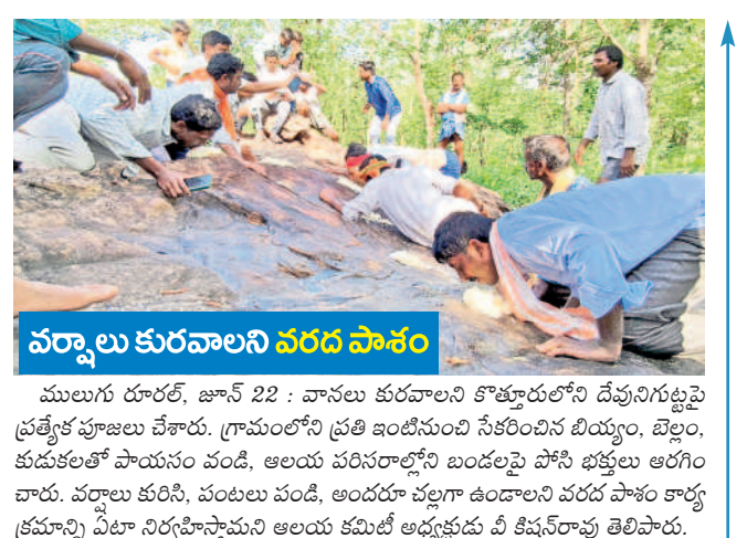
వర్షాలు కురవాలని వరద పాతం