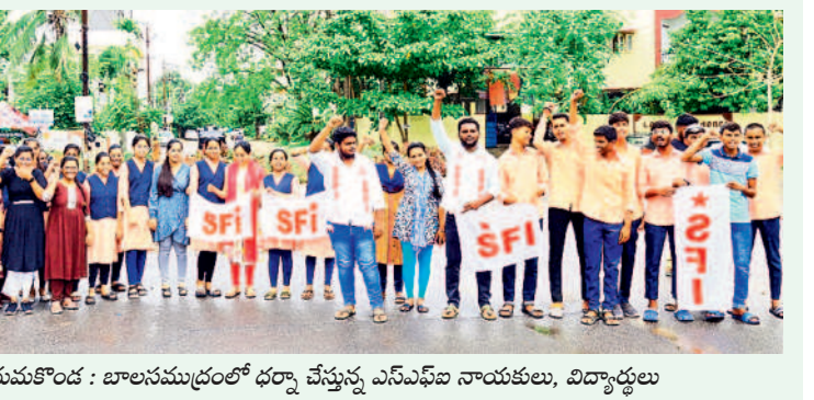
హనుమకొండ : బాలసముద్రంలో ధర్నా చేస్తున్న ఎన్.ఎఫ్.ఎ నాయకులు, విద్యార్థులు