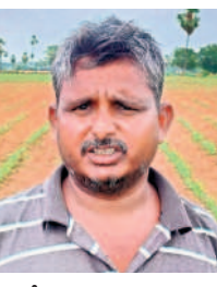
- సుకరబోయిన యాదయ్య, రైతు

ఎన్నోసార్లు ఆపీసుకు పోయి ట్రాన్స్ఫార్మర్ కోసం అడిగితే రెండు రోజుల్లో వస్తుందని చెప్పి పంపిస్తుంది. శనివారం మరొకరి పోతే ట్రాన్స్ఫార్మర్ రిపేరింగ్ సెంటర్ నంబర్ ఇచ్చారు. అక్కడికి పోనీ చేసి విషయం అడిగితే ఇప్పట్ల రాదన్నారు. నారుముడి, దుస్థితి దుస్థితి ఎండింది. 15 రోజుల నుంచి నీరు లేక వాసకాలం నాట్లు ఆలస్యమైతాయి. రెండు నెలల కింద ఒకసారి కాలింది. వారం రోజులకు ఇచ్చింది. నెల కింద మళ్ళీ కాలింది. 15 రోజుల నుంచి సాగు నీళ్లు లేక తీవ్రమైన పడుతున్నాయి.