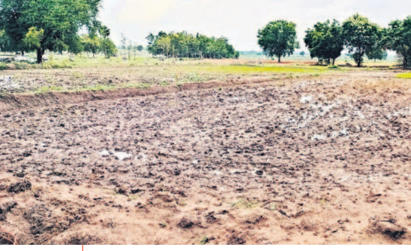
నీటి పంపింగ్ లేక ఎండిన దుక్కలు

ట్రాన్స్ఫార్మర్ కాలి 15 రోజులైతే నారు, ముక్కలు పక్కన పడిపోయాయి. వానకాలం నెత్తిమీదికి పక్కనంది. నార్లు పోసినం. నీళ్లు లేక నాట్లు లేటయితున్నాయి. ఇక రెండు ఆవులకు తాగడానికి నీళ్లు లేకుంటే దూరం నుంచి ఒక్కొక్కటి తెచ్చి తావుతున్నాయి. కరెంట్ నుంచి చుట్టూ తిరిగి యాక్సెస్ కావాలి. దబ్బాన కొత్తది తెచ్చి ఫీట్ చేసి దుస్థితి దుస్థితి కంటం. ఎన్నడు లేదా కరెంట్లో ఇంక ఆలస్యం చేస్తుంది.