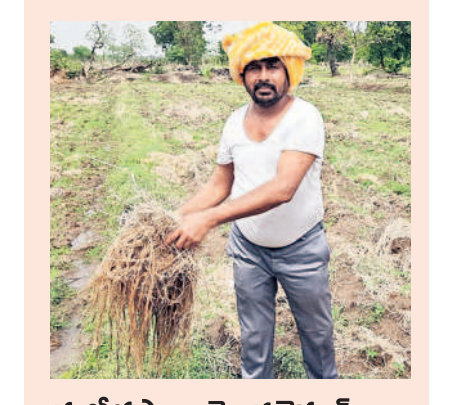
మళ్ళీ కష్టాలు మొదలైనయో..