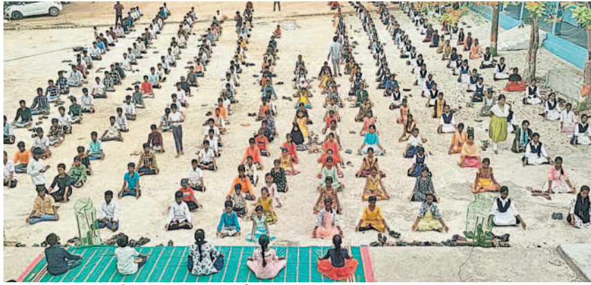
బోంరాసేపేట: ఉన్నత పాఠశాలలో యోగాసనాలు చేస్తున్న ఉపాధ్యాయులు, విద్యార్థులు

కులకచర్ల, జూన్ 21: మండల పరిషత్ లోని కామనిపల్లి గ్రామంలో ఎల్లమ్మ తల్లి బోనాలు శుక్రవారం ఘనంగా నిర్వహించారు. గ్రామం నుంచి మహిళలు బోనాలతో ఊరేగింపుగా వెళ్లి ఎల్లమ్మ తల్లికి ప్రదక్షిణ నిర్వహించారు. పోతరాజు వేదధారణతో స్వత్యాలు చేసుకుంటూ ఊరేగింపు నిర్వహించారు. అమ్మవారికి ప్రత్యేక పూజలు నిర్వహించి మొక్కులు చెల్లించుకున్నారు.