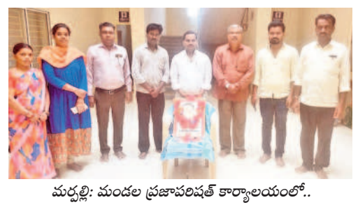
మర్నాటి: మండల ప్రజాపరిషత్ కార్యాలయంలో..