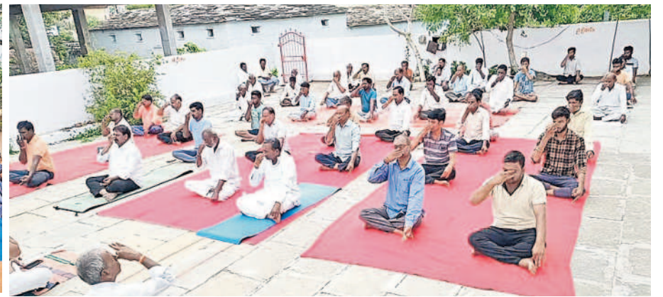
యాలాల మండల కేంద్రంలో..