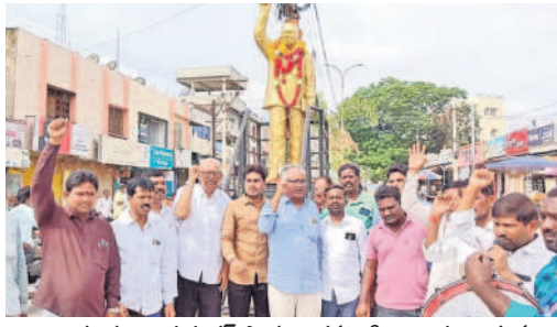
తాండూరు: జయశంకర్ సార్ విగ్రహానికి నివాళులర్పిస్తున్న తెలంగాణ ఉద్యమకారులు