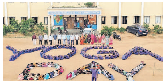
కులకచర్ల మండలం ముజాహిద్పూర్ మోడల్ స్కూల్లో..