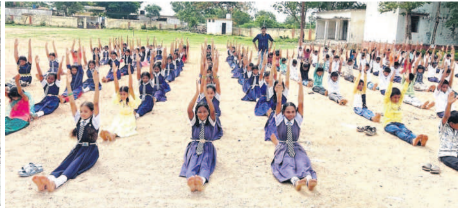
పెద్దేముల్ : మండల కేంద్రంలోని జిల్లా పరిషత్ బాలుర ఉన్నత పాఠశాలలో..