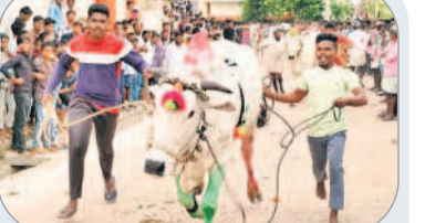
ఎద్దులను పరగిక్రమిస్తున్న రైతులు