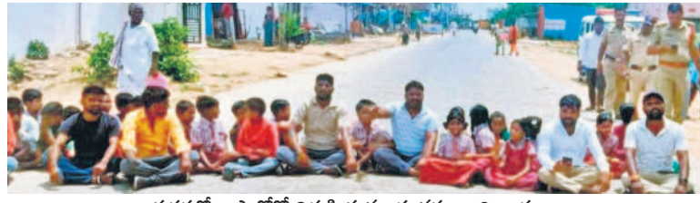
పడరలో రాస్తారోకో నిర్వహిస్తున్న యువకులు, విద్యార్థులు