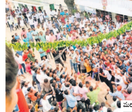
మరికలే: ఏరువాక పండుగ కోసం పోటీ పడుతున్న రైతులు

లో భాగం పండుకుంటూ అన్ని విధాలా అండగా ఉండే పశువులకు ఏరువాక పార్కు రోజు గ్రామాల్లో ఉదయాన్నే చెరువులు, కంటల వద్దకు తీసుకెళ్లి స్నానాలు చేయించి వాటి కొమ్మలకు రంగులను పూస్తారు. కాళ్లు గణ్ణెలు, మెడలో గంటలు, కుమ్మలు కట్టి శరీరం నిండా రంగులు అడ్డుతారు. ఆర్థి స్థాయిలో ఉన్న రైతులు ఎద్దులను నూతన వస్త్రాలతో అలంకరించి ఇంట్లో ఉన్న గాటి వద్దకు తీసుకొస్తారు. పండు గ సందర్భంగా చేసిన పాంగిలిన నైవేద్యంగా పెట్టి ఆ గాటికి దూప, దీపాలతో పూజలు చేసి చల్లగా చూడమనే వేడుకుంటారు. సాయంకాలం మంగళపాఠాన్ని పాఠించి ఊళ్లో ఉన్న పశువులన్నింటిని ఒక దగ్గరకు చేరుస్తారు. అక్కడి నుంచి పశువుల ఊరేగింపు ప్రజల కి రెంత