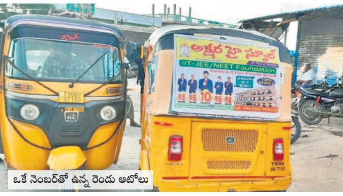
ఒకే నెంబర్తో ఉన్న రెండు ఆటోలు

మక్తల్, జూన్ 20: ఒకే రిజిస్ట్రేషన్ నెంబర్తో రెండు ఆటోలు మక్తల్ పట్టణంలో గురువారం కనిపించాయి. మక్తల్ బస్టాండ్ నుంచి ప్రయాణితులను మట్టుపక్కల గ్రామాలకు