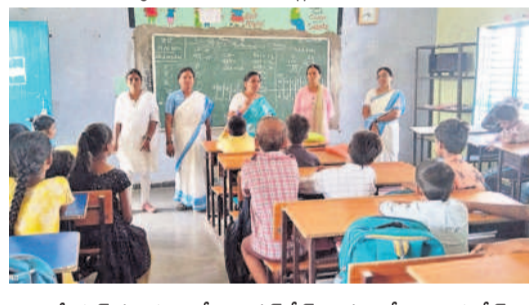
మేడ్చల్ మండలంలోని రావలకోట్ గ్రామంలో అల్ప ఆహారం పంపిణీ చేస్తున్న ఆరోగ్య సిబ్బంది