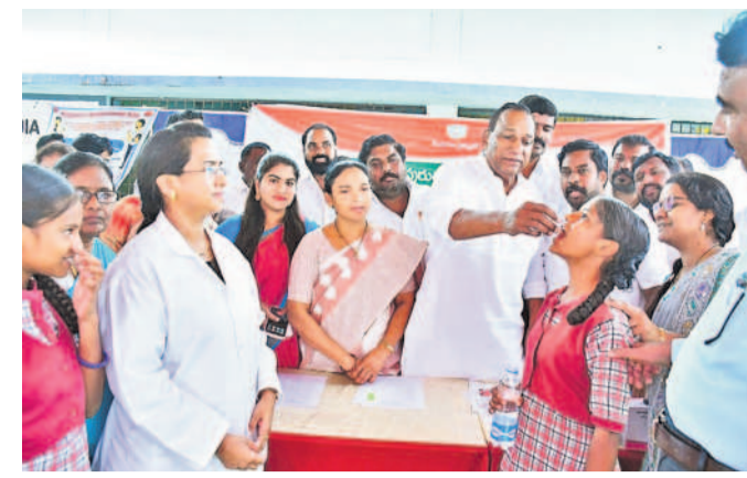
జవహర్ నగర్ లో విద్యార్థులకు సులభపురుగుల నివారణ మాత్రలు వేస్తున్న మాజీ మంత్రి, ఎమ్మెల్యే మల్లారెడ్డి