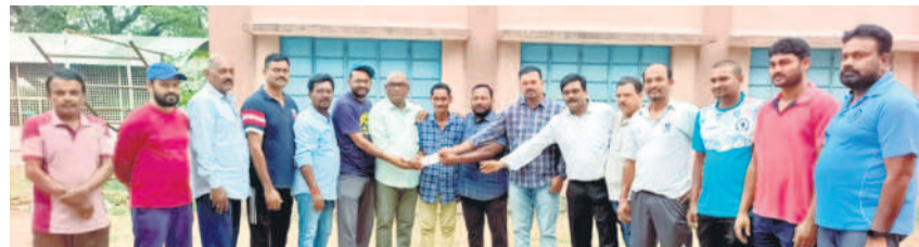
చేయూ చేయూ కలిపి.. సాయం చేసి.. ఇంతియాజీకు నగదు అందజేస్తున్న ఆర్టీ-1, 2 క్రీడాకారులు

కోల్సెట్, జూన్ 20 : మైదానంలో మానవత్వం వెల్లివిరిసింది. చేయూ చేయూ కలిపి ఓ వేదికల యువతి పెళ్లికి చేయూ అందించి శభాష్ అనిపించుకున్నారు. గోదావరిఖని జవహర్నగర్ జిల్లాలోని స్టేడియంలో ఇంతియాజీ 30 ఏళ్లకే స్టేడియం కీవర్గా పని చేస్తున్నాడు. ఆయన కుమార్తె వివాహం ఇటీవల నిశ్చయమైంది. అయితే పెళ్లి ఖర్చులకు ఇబ్బంది పడుతున్నారన్న విషయం గుర్తించి ఆర్టీ-1, 2 క్రీడాకారులు, కార్మికులు కలిసి గురువారం సాయంత్రం స్టేడియం ఆవరణలో ఇంతియాజీకు ₹ 1.87 లక్షల ఆర్థిక సాయం అందించి బౌద్ధి చాటుకున్నారు.