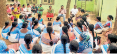
బొంబాయిపేటలో మాత్రం పంపిణీపై సిబ్బందికి అవగాహన కల్పిస్తున్న అధికారులు

బొంబాయి, జూన్ 19 : చిన్న పిల్లలతో పాటు యువత అనారోగ్యానికి కారణమవుతున్న సులి పురుగులను నివారించడానికి ఏటా రెండుసార్లు జాతీయ సులి పురుగుల నివారణ దినాన్ని పాటిస్తున్నారు. ఈ ఏడాది ఫిబ్రవరిలో ఒకసారి సులి పురుగుల నివారణ దినం నిర్వహించగా, గురువారం రెండోసారి నిర్వహిస్తున్నారు. సులి పురుగుల నివారణకు 1-19 సంవత్సరాల వయస్సు వారికి అలెండజోల్ మాత్రం పంపిణీ చేస్తారు. 1 నుంచి 2 ఏండ్ల వయసున్న వారికి సగం మాత్ర, 2-19 ఏండ్ల వయసున్న వారికి ఒక మాత్రం వేయాలి. మాత్రం పంపిణీపై వైద్య ఆరోగ్యశాఖ అధికారులు ఇప్పటికే సిబ్బందికి అవగాహన కల్పించారు. గురువారం మాత్రం పంపిణీ చేయని వారికి ఈ నెల 27వ తేదీన మావీఆప్ ప్రోగ్రాం పేరుతో అలెండజోల్ మాత్రం పంపిణీ చేస్తారు.