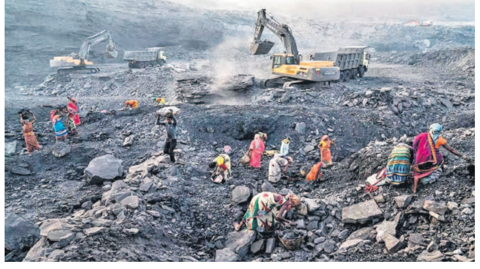
దులు 100 శాతం అనుమతి ఉన్నందున బయటి దేశాలకు కూడా ఈ అవకాశం ఉన్నది. సింగరేణి వెబ్సైట్ ప్రకారం ఇప్పుడు 18 ఓపెన్ కాస్టులు, 24 భూగర్భ గనులు దాని ఆధీనంలో ఉన్నాయి.

తెలంగాణ బిడ్డ అయిన కేంద్ర గనుల శాఖ మంత్రి జి.కిషన్ రెడ్డి 'గనులు మీరు వేలం వేస్తారా.. మమ్మల్ని వేయమంటారా?' అని రాష్ట్ర ప్రభుత్వానికి హెచ్చులక చేశారు. పదవీ స్వీకారం చేసిన మూడు రోజులకే రాష్ట్రంలో సహజంగా సింగరేణికి రావలసిన బొగ్గు గనులను ప్రైవేటుపరం చేసేందుకు తొందరపడుతున్నారు. తెలంగాణకు గని మాణిక్యమైన 185 ఏండ్ల సింగరేణికి మంగళం పాడేందుకు కేంద్రంలో బీజేపీ సర్కారు ప్రణాళికలు మొదలయ్యాయి. కొత్త గనుల కోసం సింగరేణి ఇందులో పాల్గొంటే ప్రైవేటు శక్తులతో అది తట్టుకోగలదా అనేదే అనుమానం.