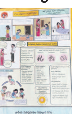
నులి పురుగుల నివారణే ధ్యేయం