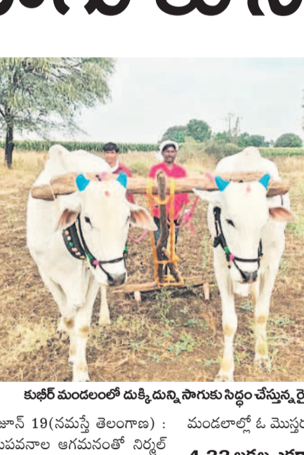
కుటీర్ మండలంలో దుక్క దున్ని సాగుకు సిద్ధం చేస్తున్న రైతులు.