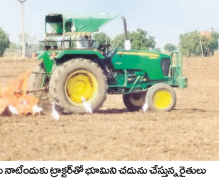
పత్తి విత్తనాలు నాటేందుకు ట్రాక్టర్ తో భూమి చదును చేస్తున్న రైతులు.

66 వేల మెట్రిక్ టన్నుల ఎరువులు జిల్లా వ్యాప్తంగా ఆయా డిలర్ల వద్ద ప్రస్తుతం 1.19 లక్షల పత్తి విత్తన ప్యాకెట్లు అందుబాటులో ఉన్నట్లు అధికారులు చెబుతున్నారు. ఇందులో వరి 23,900 క్వింటాళ్లు, సోయా 25వేల క్వింటాళ్లు, మక్క 1,440 క్వింటాళ్లు విత్తనాలు మార్కెట్లో ఉన్నాయి. ఇప్పటికే జిల్లా రైతులు 2.60 లక్షల పత్తి విత్తన ప్యాకెట్లను కొనుగోలు చేశారు. రోజువారం, బాసర, సారంగాపూర్, కుభీర్, తానూర్, ఖైసా మండలాల్లో తొలకరి వర్షానికి కొంత మంది పత్తి విత్తనాలు నాటారు. కాగా.. ఎరువులు 66 వేల మెట్రిక్ టన్నులు అవసరమవుతాయని అధికారులు అంచనా వేయగా, ప్రస్తుతం 27,400 మెట్రిక్ టన్నులు అందుబాటులో ఉన్నాయి. యారీయా 36వేల మెట్రిక్ టన్నులకు 15వేలు, కాంపైన్ 15వేలు, ఎరువులు 18వేల మెట్రిక్ టన్నులకు 8 వేలు, డీపీవీ 12 వేల మెట్రిక్ టన్నులకు 4,400 అందుబాటులో ఉన్నట్లు అధికారులు చెబుతున్నారు. అవసరాన్ని బట్టి మిగతా ఎరువులను కూడా తెప్పించేందుకు చర్యలు తీసుకుంటున్నారు.