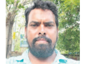
- గవ్వల లోకోత్, రైతు, కష్టర్, తాసి మండలం.

కేసీఆర్ ప్రభుత్వ పాలనలో కప్పు మూసి కప్పు తెరిచేలోపు కరెంటు వచ్చేది. కాంగ్రెస్ హయాంలో ఎప్పుడు వస్తుందో.. అసలు రాదో తెలియడం లేదు. రాత్రి చేసుకు వెళ్లి కరెంటు పెట్టాల్సిన దుస్థితి వచ్చింది. బీఆర్ఎస్ సర్కారు ఉచితంగా ఇచ్చిన 24 గంటల కరెంటుతో పోషాన్ లేకుండా పంటలు పండించడం మున్న ఇబ్బంది అవుతుంది. అసలు పంటలు వేయాలంటే నష్టం పట్టండేమాననే భయం వేస్తున్నది.