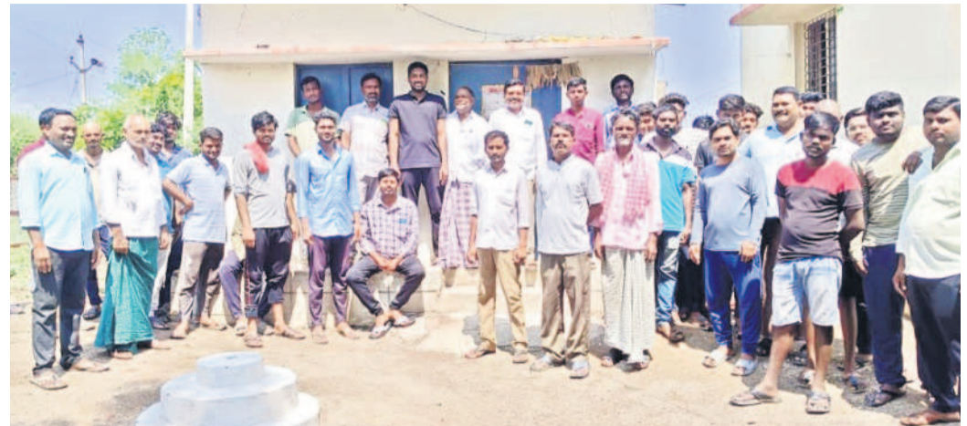
విద్యుత్ కోతలకు నిరసనగా తలమడుగు సబ్ స్టేషన్ ముట్టడించిన గ్రామస్థులు. రైతులు