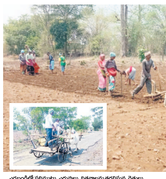
ఎడ్లబండిలో పనిముట్లు, ఎరువులు, విత్తనాలును తరలిస్తున్న రైతులు