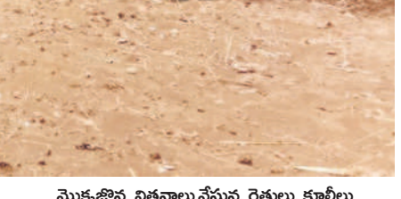
మొక్కజొన్న, విత్తనాలు వేస్తున్న రైతులు, కూలిలు