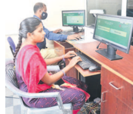
పని గ్రామాలకు ఒక టీం పంపమని పని చేశారు. కాగా.. మార్చి 1 నుంచి 9వ తేదీ వరకు పెండింగ్ దరఖాస్తుల పరిశీలన

● ఈ నెలాఖరులోగా పూర్తి చేయాలనే ప్రభుత్వ ఆదేశాలు బెజాతరు ● రెవెన్యూ కార్యాలయాల చుట్టూ ప్రదర్శనలు చేస్తున్న జనం "పార్లమెంట్ ఎన్నికల ప్రక్రియలో భాగంగా వచ్చిన రెవెన్యూ అధికారులు తిరిగి బదిలీ కోసం ఎదురుచూస్తున్నారు. త్వరలో ట్రాన్స్ ఫర్డ్ ఉంటాయని తెలియడంతో పోస్టింగ్ కోసం పైరెవీలు చేస్తున్నారు. ఆ బదిలీ ధరణి లెఫ్టినెంట్ ను పట్టించుకోవడం లేదు. కార్యాలయాలకు వెళ్లిన వారికి వారం, పది రోజుల్లో కొత్త అధికారులు వస్తారు. ఇప్పుడు మేం మామెంట్ చేసినా బదిలీ అయ్యక లోగిపోతంది. కొన్ని రోజులు ఆగి కొత్తవారు వచ్చిన తరువాత చేయించుకుంటే పని అయిపోతంది అని చెప్పి వదిలిస్తున్నారు."