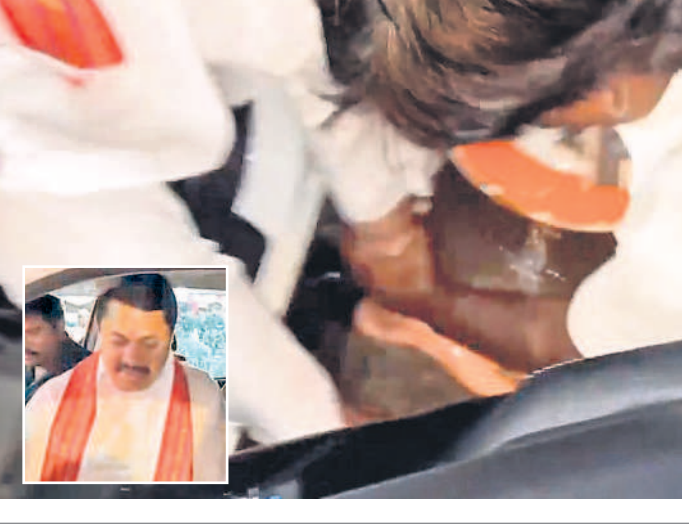
కార్యకర్తలతో కాళ్ళ కడిగింపు కార్యక్రమం

దని బైడెన్ ప్రకటించింది. బైడెన్ కొత్త ప్రకటన ప్రకారం వేలాది మంది భారత సంతతి అమెరికన్లతో సహా దాదాపు 5 లక్షల మంది వలసదారులు అమెరికా పౌరసత్వం పొందుతారని బైడెన్ సీనియర్ అధికారి ఒకరు వెల్లడించారు. దరఖాస్తు చేసేందుకు అర్హత వలసదారులందరికీ ఒక వలసదారు సోమ వారం నాటికి అమెరికాలో 10 ఏండ్లు నివాసం ఉండటంతోపాటు అమెరికా పౌరుల దీని వివాహం చేసుకోని ఉండాలి. క్యాన్సిల్ అయిన వలసదారు దరఖాస్తు ఆమోదం తర్వాత.. అతను లేదా ఆమె గ్రీన్ కార్డు కోసం దరఖాస్తు చేసుకోవచ్చు, తాత్కాలిక వర్క పర్మిట్ పొందేందుకు, బహిష్కరణ నుంచి రక్షణ పొందేందుకు మూడేళ్ల సమయం ఉంటుంది అధికారి వర్గాలు తెలిపాయి.