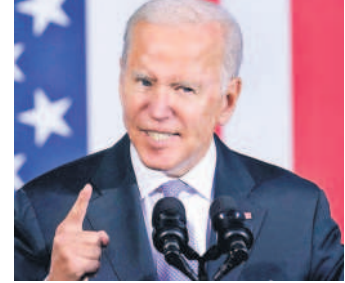
ఉండేలా చర్యలు తీసుకోవాలి హోంల్యాండ్ సెక్యూరిటీ విభాగానికి బైడెన్ ఆదేశాలు జారీ చేశారు. లీగల్ స్టేటస్ లేకుండా ఉంటున్న అమెరికా పౌరుల జీవిత భాగస్వాములకు సెన్సోస్ అవకాశం ప్రభుత్వం కల్పించనున్నట్లు

వాషింగ్టన్, జూన్ 18: అమెరికాలో చట్టబద్ధమైన హోదా లేని లక్షలాది మంది వలసదారులకు ఉపకమనం కల్పిస్తూ ఆ దేశ అధ్యక్షుడు బైడెన్ కీలక ప్రకటన చేశారు. అమెరికా పౌరుల విదేశీ జీవిత భాగస్వాములు, వారి పిల్లలకు దేశ పౌరసత్వం కల్పించనున్నట్లు వెల్లడించారు. దాదాపు 5 లక్షల మందికి ఈ నిర్ణయం ద్వారా ప్రయోజనం చేకూరుతున్నట్లు అంచనా. వేలాది మంది భారతీయులకు కూడా ఇది లబ్ధి చేకూరుతున్నది. విదేశీ జీవిత భాగస్వామ్య కలిగిన అమెరికా పౌరులు, వారి పిల్లలు కలిసి