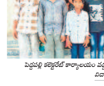
పెద్దపల్లి కలెక్టరేట్ కార్యాలయం వద్ద ఆందోళన చేస్తున్న వెంకటాపూర్ గురుకులం పాఠశాల విద్యార్థులు, తల్లిదండ్రులు

వెంకటాపూర్లోని కాటారం బీసీ గురుకులం పాఠశాల సమస్యలకు నిలయాంగా మారింది. కూలిపోయే గోడలు.. దోర్ల తేని బాతరూ మొ.. పెచ్చులాడిన తరగతి గదులతో ప్రమాదకరంగా ఉన్నట్లు. పైగా సరైన సౌకర్యాల లేక సుమారు 260 మంది విద్యార్థులు ఇబ్బంది పడతూ వస్తున్నట్లు. విద్యార్థుల తమ సమస్యల పరిష్కారం కోసం మంగళవారం పెద్దపల్లి కలెక్టరేట్ కు వచ్చి అరసన తెలిపారు. వసతుల లేమి తోపాటు విద్యార్థులకు కూడా బాగాలేదని విద్యార్థుల తల్లిదండ్రులు ఆరోపిస్తున్నారు.