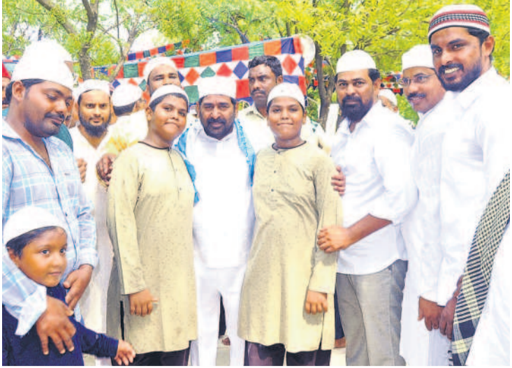
సూర్యాపేటలో ముస్లింలకు బుక్ డిస్ట్రీబ్యూషన్ కార్యక్రమం.