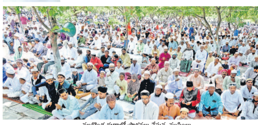
నల్లగొండ ఈద్గాహ్లో ప్రార్థనలు చేస్తున్న ముస్లింలు