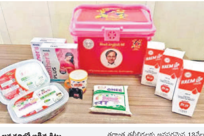
జనవరిలో ఆగిన కిట్లు

సూర్యాపేట, జూన్ 17 (నమస్తే తెలంగాణ) : పుట్టబోయే శిశువులకు తగినంత కెరెండ్ల లోపం ఉండొద్దనే ఉద్దేశంతో కేసీఆర్ సర్కారు హయాంలో ఆంధ్రప్రదేశ్ న్యూట్రిషన్ కిట్లకు ప్రస్తుత కాంగ్రెస్ ప్రభుత్వంలో గ్రహణం పట్టింది. నాలుగు నెలలుగా గర్భిణులకు ఇవ్వాలన్న సుమారు ఆరు వేల కిట్లు ఆందలేదు. గర్భం దాల్చిన నాటి నుంచి ప్రసవం వరకు ఐదు, తొమ్మిదో నెలల్లో మొత్తం రెండు సార్లు రూ. 2 వేల విలువ చేసే పోషకాహార తో కూడిన కిట్లను గత ప్రభుత్వం అందించింది. ఇవి గత ఫిబ్రవరి వరకు సజావుగా ప్రస్తుతం వాటి ఊన్ లో కుండా పోయింది. ఇక గర్భిణులు, పుట్టిన శిశువులకు గతంలో ఇచ్చిన కేసీఆర్ కిట్లను ఎంపీఐఎన్ కిట్లకు పేరు మార్చిన కాంగ్రెస్ ప్రభుత్వం వాటిని కూడా నిలిపివేయడం పట్ల మహిళలు గుర్తగా ఉన్నారు.