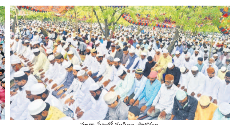
సూర్యాపేటలో ముస్లింల ప్రార్థనలు