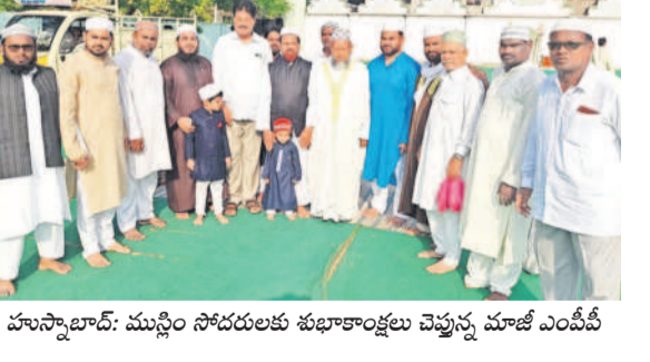
హుస్సేన్లో: ముస్లిం సోదరులకు శుభాకాంక్షలు చెబుతున్న మాజీ ఎంపీ