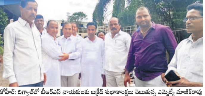
కోహార్: బిగ్నాలో బీఆర్ఎస్ నాయకులకు బక్రీద్ శుభాకాంక్షలు చెబుతున్న ఎమ్మెల్యే మాజీకేర్రావు