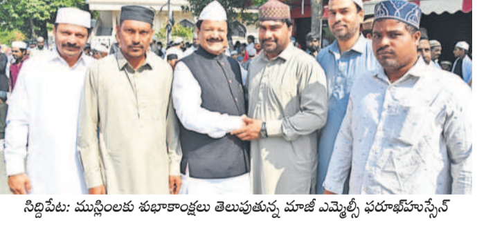
సిద్దిపేట: ముస్లింలకు శుభాకాంక్షలు తెలుపుతున్న మాజీ ఎమ్మెల్యే ఫరూఖ్ హుస్సేన్