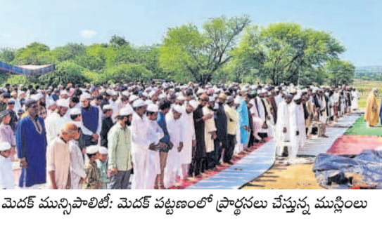
మెదక్ ముస్లింపాలిలో: మెదక్ పట్టణంలో ప్రార్థనలు చేస్తున్న ముస్లింలు