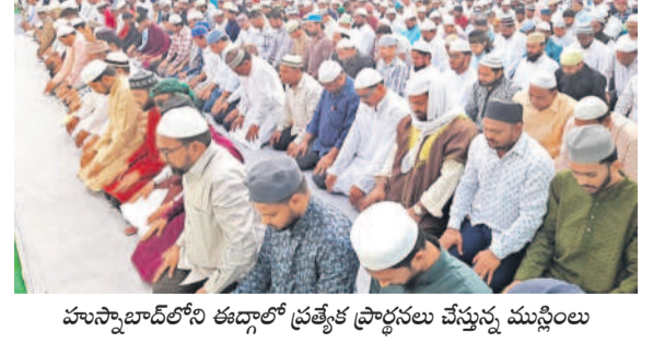
హుస్సేన్లోని ఈడ్గాలో ప్రత్యేక ప్రార్థనలు చేస్తున్న ముస్లింలు