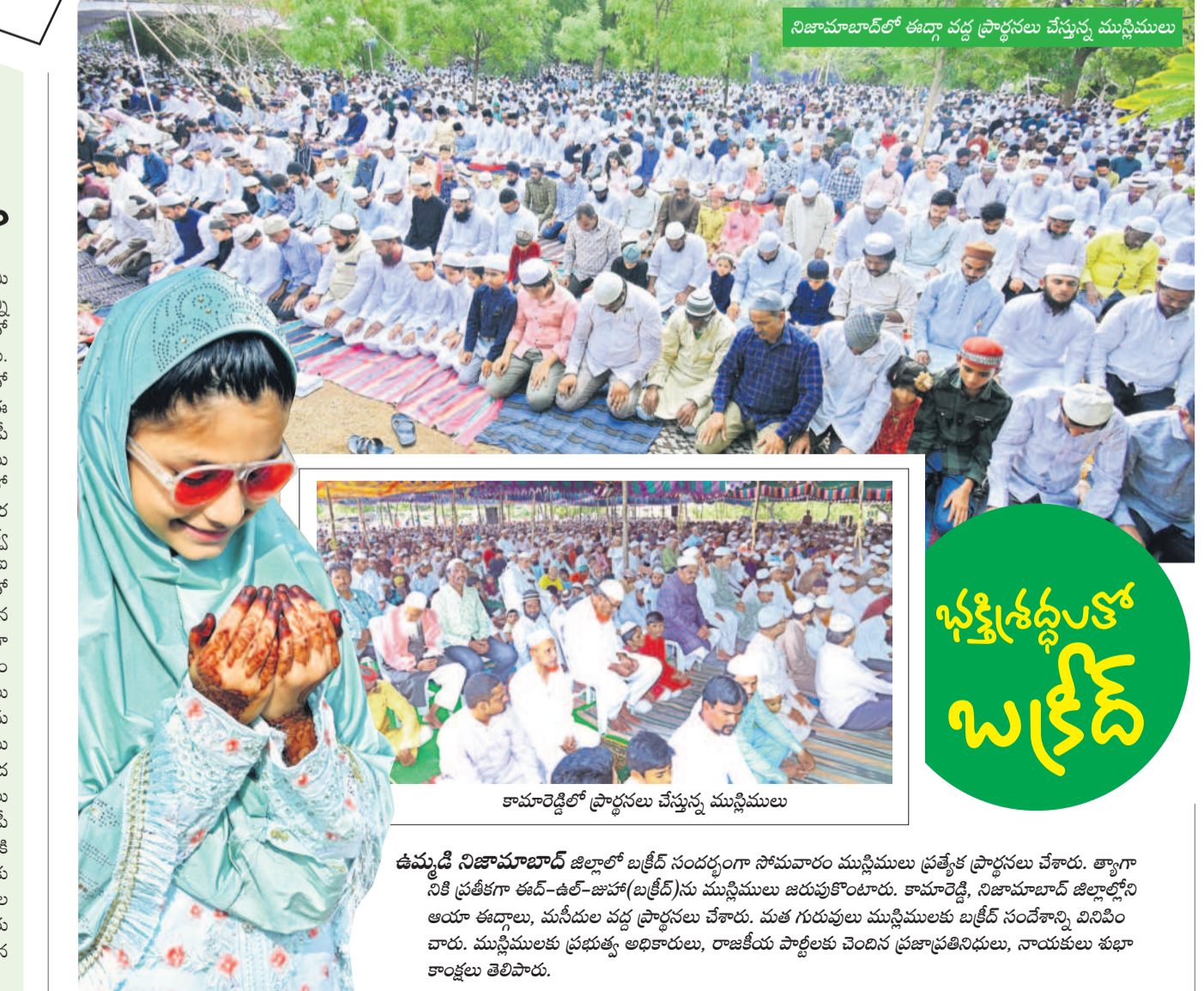
కామారెడ్డిలో ప్రార్థనలు చేస్తున్న ముస్లిములు

వి.రాయ్ కనగర్, జూన్ 17: నిజామాబాద్ కమిషనరీలో విడులు నిర్వహిస్తున్న సీపీఎస్ సీపీ కొన్ని నెలల క్రితం ఓ చోరీ కేసులో డిమాండ్ చేరుకుంటూనే ఉన్నాడు. తలదూర్చడంతో సస్పెన్షన్ కు గురయ్యాడు. తాజాగా పెట్రోలింగ్ చేసేందుకు వెళ్లిన సీపీకి గొడవకు దిగడంతో ఇతర సిబ్బంది ద్వారా ఈ విషయం సీపీ దృష్టికి వెళ్లింది. సదరు సీపీ చర్యలు తీసుకున్నట్లు సమాచారం. తోటి పోలీసు సిబ్బంది కడపం ప్రకారం.. సీపీఎస్ విభాగంలో విడులు నిర్వహిస్తున్న ఓ సీపీ అధికారుల రాత్రి సగర శివారులోని ఐటీ కేస్ పరిధిలో పెట్రోలింగ్ నిర్వహించేందుకు వెళ్లారు. మళ్లీ ఉన్న సదరు సీపీ బాటపనులేవో సీపీ ప్రాంతానికి వెళ్లి, స్థానికులతో ఆయన గొడవకు దిగడం తెలిసింది. గొడవపడిన సమయంలో యువకులు పెద్ద మొత్తంలో ఘటనా ప్రధానానికి చేరుకొని సీపీని నిలదీశారు. ఆ సమయంలో ఆయన మద్దం సేవించి ఉన్నట్లు స్థానికులు గుర్తించి తిరగబడి ప్రయత్నం చేశారు. అదే సమయంలో ఐదవ లోన్ ఎమ్మెల్యే పెట్రోలింగ్ చేస్తూ వెళ్లగా, సీపీతో వ్యాధానికీ దిగిన వారిని చెదరగొట్టాడు. సీపీ మద్దం మత్తులో ఉన్నట్లు స్థానికులు గుర్తించారు.. ఈ విషయం సీపీ దృష్టికి వెళ్లింది. సీపీ సదరు సీపీ హైదరాబాద్ గాంధీ దవాఖానకు చికిత్స సేవకు పంపించారు. సదరు సీపీ ఎన్ఫోర్స్ మెంట్ కేసులో డిమాండ్ చేస్తున్న వేరుతల తల దూర్చడంతో సీపీని సస్పెండ్ చేశారు. మరోవారు సీపీపై ఆరోపణలు రావడంతో శాఖా పరమైన చర్యలు తీసుకున్నట్లు తెలిసింది.