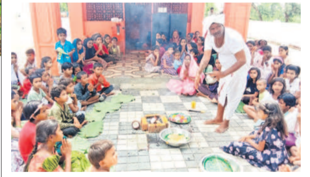
బోధన్ మండలం రాజ్ కుమార్ గృహ కుటుంబాల సంఘం వారు చేస్తున్న గ్రామీణులు

-నిజామాబాద్, జూన్ 17 (నమస్తే తెలంగాణ ప్రతినిధి)