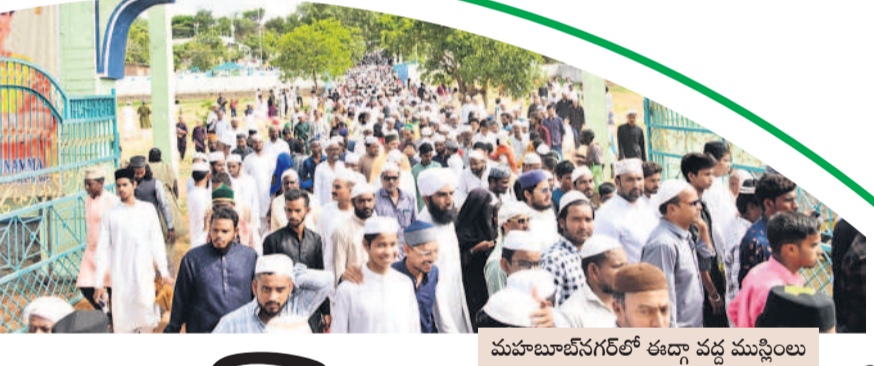
మహబూబ్ నగర్ లో ఈద్గా వద్ద ముస్లింలు