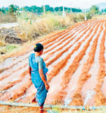
వసంతపూర్ శివారులో పైపును ఏర్పాటు చేసిన రంధ్రాల సాయంతో నీటిని పొలిస్తున్న మహిళా రైతు

వానమ్మ...వానమ్మ.. వానమ్మా.. ఒక్క సారన్నా వచ్చిపోవో వానమ్మా.. అని పాడుకునే పరిస్థితులుగా రైతులు లకు. పది రోజులుగా వరుణుడు పత్తాలేకపోవడంతో రైతులు ఆకాశం వంక ఆశతో ఎదురు చూస్తున్నారు. గతేడాది మాదిరిగా ఈనెలలో కూడా ముందుగానే పలకరించిన తొలకరితో విత్తనాలు వేసుకున్న కర్షకులు ఇప్పుడు వర్షాల కొరం ఎదురు చూస్తున్నారు. మరో వారం రోజులు ఇలాగే ఉంటే వేసిన విత్తనాలు భూమిలో కలిసిపోతాయేమోననే బెంగు రైతుల్లో నెలకొన్నది.