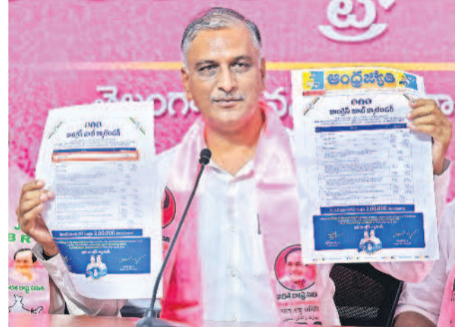
నిరుద్యోగుల తరపున ప్రభుత్వానికి 5 డిమాండ్లు