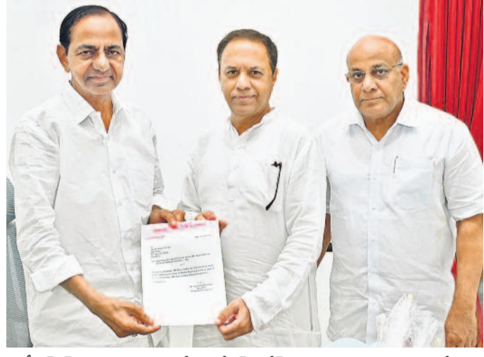
బీఆర్ఎస్ పార్లమెంటు పార్టీ నేతగా కేఆర్ సురేశ్ రెడ్డిని నియమిస్తూ అధికారిక లేఖను అందజేస్తున్న బీఆర్ఎస్ అధినేత కేసీఆర్. చిత్రంలో ఎంపీ దీపకొండ దామోదరరావు

గ్రూప్ పరీక్షలపై ఒత్తిడి తేండి గ్రూప్-1 మెయిన్స్కు 1:100 మందిని అనుమతించేలా ప్రభుత్వాన్ని నిలదీయండి > 3 మాజీ మంత్రి హరీష్ కౌరవకు అభ్యర్థుల వినతి