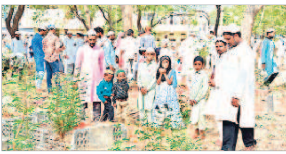
మంచిర్యాల జిల్లా కేంద్రంలోని ఖైలాస్థాన్ లో సమాధుల వద్ద ప్రార్థనలు చేస్తున్న ముస్లింలు