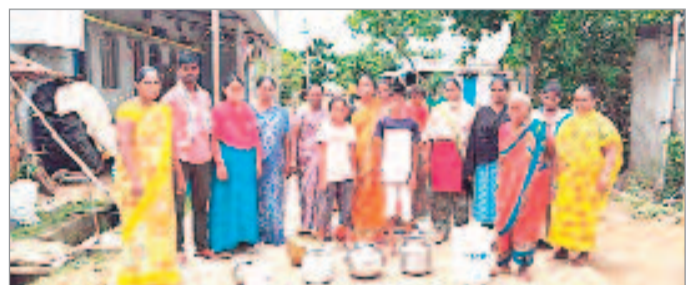
ట్రాండెడ్ లేబర్ కాలనీలో నిరసన తెలుపుతున్న మహిళలు