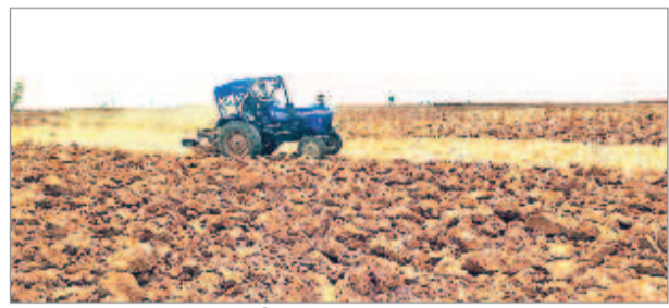
చేసులో దుక్కి దున్నుతున్న ట్రాక్టర్