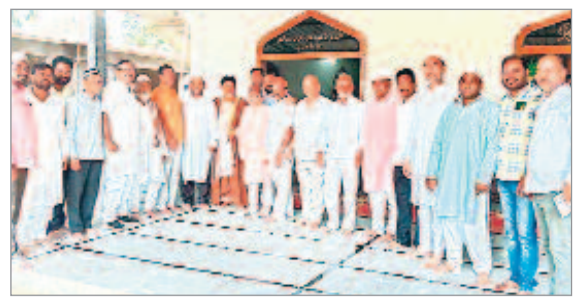
తాండూర్ : ముస్లింలకు పండుగ శుభాకాంక్షలు తెలుపుతున్న ప్రజాప్రతినిధులు, నాయకులు