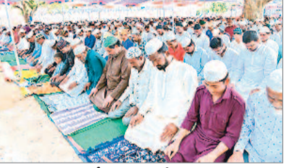
మంచిర్యాలలో ప్రార్థనలు చేస్తున్న ముస్లింలు..