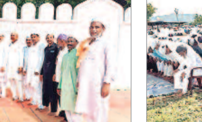
కెరమెల : సుల్తాన్ గూడలోని ఈడ్గా వద్ద..