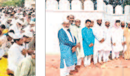
చెన్నూర్ టౌన్ : ఈడ్గా వద్ద..