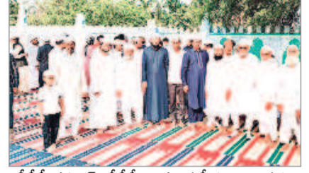
సీసీ నస్సూర్ : సీసీ నస్సూర్ జామా మసీదు ఈడ్గా వద్ద..

-మంచిర్యాల ఐసీ/దండేపల్లి/జూరం/తాండూర్/నెన్నెల/సీసీ నస్సూర్/లక్ష్మణపేట/కన్నెపల్లి/చెన్నూర్ టౌన్/మండలం/కాసిపేట/అసిఫాబాద్ టౌన్/కెరమెల/జైసూర్ జూన్ 17