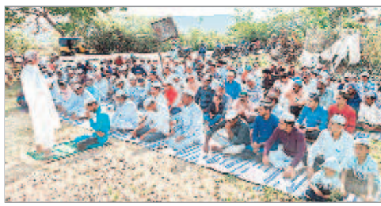
దండేపల్లి : తాళ్లపేటలోని ఈడ్గా వద్ద ఇమామ్ సందేశ్ నాస్ వింటున్న ముస్లింలు