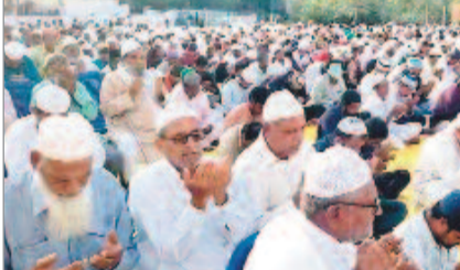
లక్ష్మణపేటలో ప్రార్థనలు చేస్తున్న ముస్లింలు