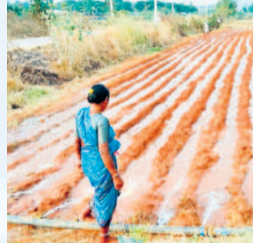
వసంతపూర్ శివారులో పైపునకు ఏర్పాటు చేసిన రంధ్రాల సాయంతో నీటిని పాలిస్తున్న మహిళా రైతు

వానమ్మ...వానమ్మ.. వానమ్మా.. ఒక్క సారన్నా వచ్చిపోవో వానమ్మా.. అని పాడుకునే పరిస్థితులుగా రైతులకు. పది రోజులుగా వరుణుడు పత్తాలేకపోవడంతో రైతులు ఆకాశం వంక ఆశతో ఎదురు చూస్తున్నారు. గతేడాది మాదిరిగా ఈనెలలో కూడా ముందుగానే పలకరించిన తొలకరితో విత్తనాలు వేసుకున్న కర్షకులు ఇప్పుడు వర్షాల కోసం ఎదురు చూస్తున్నారు. మరో వారం రోజులు ఇలాగే ఉంటే వేసిన విత్తనాలు భూమిలో కలిసిపోతాయేమోననే బెంగు రైతుల్లో నెలకొన్నది.