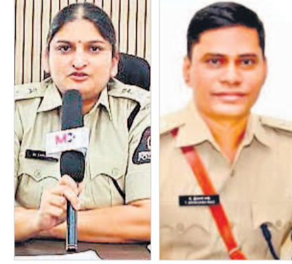
జానకి ధరావత్, శ్రీనివాసరావు

• పాలమూరు ఎస్పీగా జానకి ధరావత్, గద్వాల ఎస్పీగా శ్రీనివాసరావు మహబూబ్ నగర్ / గద్వాల అర్బన్, జూన్ 17 : రాష్ట్ర వ్యాప్తంగా వివిధ జిల్లాల్లో విధులు నిర్వహిస్తున్న పోలీస్ అధికారులకు స్థానచలనం కల్పిస్తూ ప్రభుత్వం నిర్ణయం తీసుకున్నది. అందులో భాగంగా మహబూబ్ నగర్ జిల్లా పోలీస్ బాస్ గా జానకి ధరావత్ ను నియమిస్తూ ప్రభుత్వ ప్రధాన కార్యదర్శి శాంతికుమారి సోమవారం రాత్రి ఉత్తర్వులు జారీ చేశారు. రాష్ట్ర వ్యాప్తంగా జూన్ నెల 28 మంది ఎస్పీలను బదిలీ చేయగా 2013 ఏప్రిల్ నుండి జూన్ వరకు జానకి ధరావత్ ఈస్ట్ జిల్లాలో పనిచేస్తూ మహబూబ్ నగర్ ఎస్పీగా బదిలీ చేశారు. ఈమె గతంలో మల్కాజ్ గిరి డి.సి.పీగా పనిచేశారు. ఇక్కడ పనిచేస్తున్న హద్దపర్లకు పైదరాబాద్ సైబర్ సెక్యూరిటీ బ్యూరోగా పోస్టింగ్ ఇచ్చారు. జానకి ధరావత్ మంగళవారం