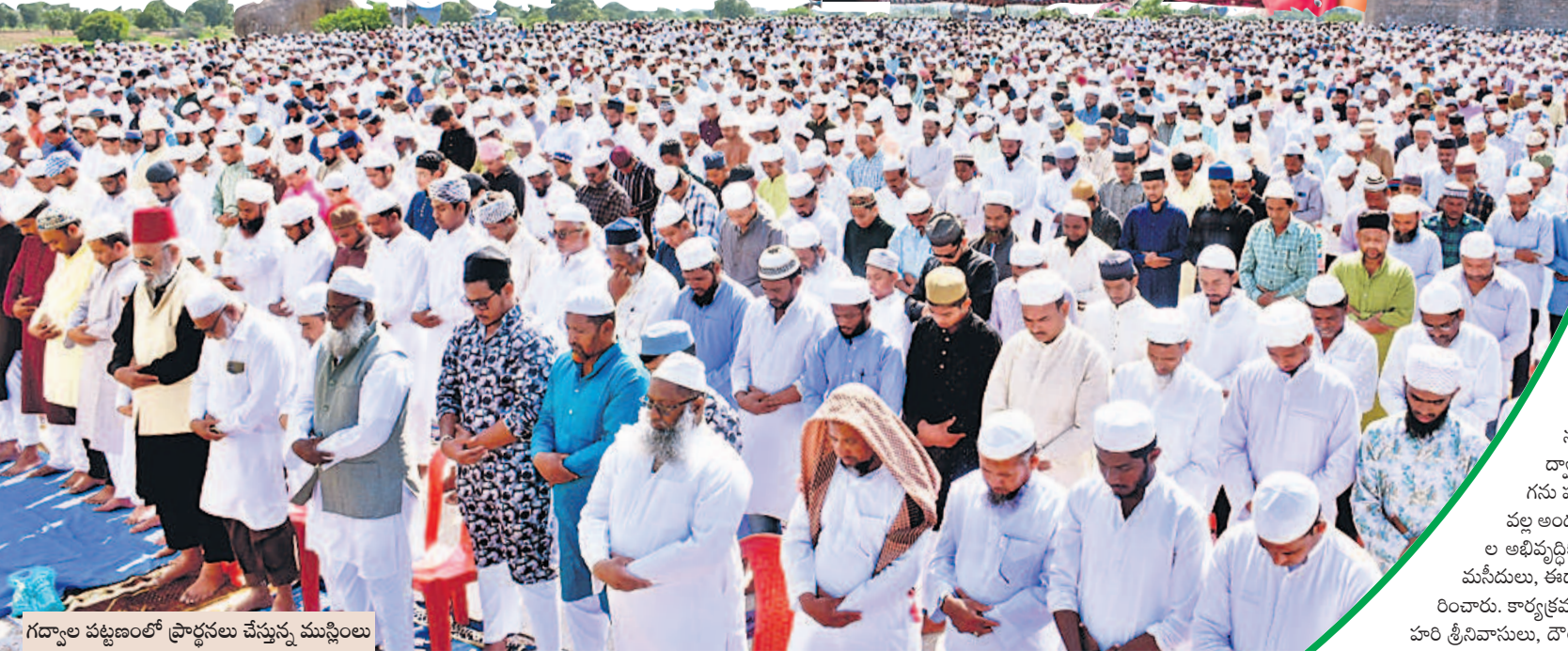
గద్వాల పట్టణంలో ప్రార్థనలు చేస్తున్న ముస్లింలు