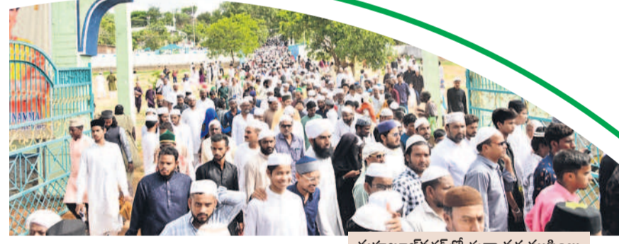
మహబూబ్ నగర్ లో ఈద్గా వద్ద ముస్లింలు