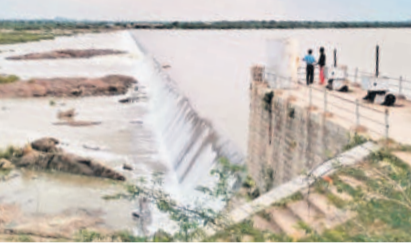
అల్లీవెన్ ఆనకట్టపై నుంచి పారుతున్న వరద

• ఇన్ఫో 6,691, అవుట్ ఫో 2,779 క్యూసెక్కులుగా నమోదు గద్వాల, జూన్ 17 : జూరాల ప్రాంతానికి వరద కొనసాగుతున్నది. ప్రత్యేక జూరాలకు వరద తగ్గతూ పెరుగుతూ ఉన్నది. సోమవారం ఎగువ నుంచి 6,691 క్యూసెక్కుల వరద వచ్చి చేరుతున్నట్లు అధికారులు తెలిపారు. పూర్వోన్నత నీటి మట్టం 9.657 టీఎంసీలు కాగా ప్రస్తుతం 8.869 టీఎంసీలు ఉన్నాయి. కాగా నెట్టెంపాడ్ లిఫ్ట్ కు 375, భీమా లిఫ్ట్-1కు 650, కొయిలసాగర్ లిఫ్ట్ కు 315, సమాంతర కాల్వకు 800, భీమా లిఫ్ట్-2కు 583 క్యూసెక్కులను విడుదల చేస్తున్నారు. దీంతో అవుట్ ఫో 2,779 క్యూసెక్కులుగా నమోదైనట్లు అధికారులు తెలిపారు. అల్లీవెన్ ఆనకట్టకు స్వల్ప వరద అయిది, జూన్ 17 : కర్ణాటకలోని అల్లీవెన్ ఆనకట్టకు స్వల్ప వరద కొనసాగుతున్నది. 4,329 క్యూసెక్కుల ఇన్ ఫో ఉండగా, అవుట్ ఫో 4,329 క్యూసెక్కులు సుంకేసుల బ్యారేజీకి చేరుకోవడం ఏకా రాందాస్ తెలిపారు. ప్రస్తుతం ఆనకట్టలో 8.6 అడుగుల నీటిమట్టం ఉన్నది.