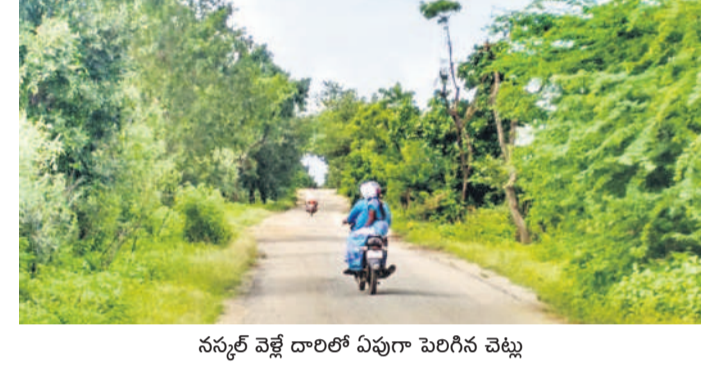
నన్యల్ వెళ్లే దారిలో ఏపుగా పెరిగిన చెట్లు