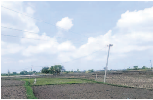
వంగం విద్యుత్ స్తంభాలు