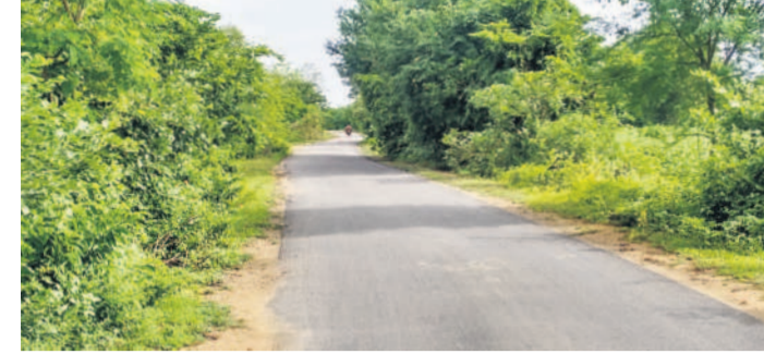
చర్లకడ నుంచి నందగోకుల్ క్రాస్ రోడ్డులో చెట్లు