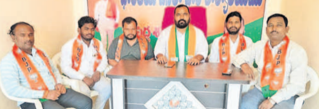
సమావేశంలో మాట్లాడుతున్న మండల బీజేపీ నాయకులు

పెద్దకంకరపేట, జూన్ 16: గోవులను సంరక్షించాలని కోరుతూ సంఘం ప్రకటించింది. నీటి మెడన బీజేపీ నాయకులను పోలీసులు అరెస్ట్ చేయడం సమంజసం కాదని ఆ ప్రాంత మండల అధికారులు కోసం విరల అన్నారు. ఆదివారం స్థానిక పార్టీ కార్యాలయంలో ఆయన మాట్లాడుతూ గోవులను సంరక్షించాలని ప్రకటించారు.