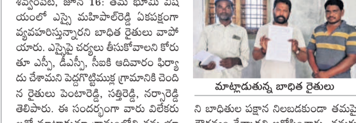
మాట్లాడుతున్న బాధిత రైతులు

ని బాధితుల పక్షాన నిలబడకుండా తప్పని దౌర్జన్యం చేస్తాడని ఆరోపించారు. తమకు వివాదంలో ఎస్సెవై మహిళారాజ్ కల్పించినట్లు తెలిపారు.