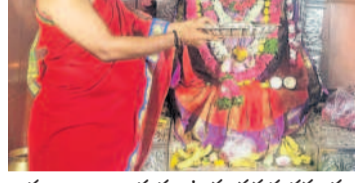
పూజలు అందుకుంటున్న వనదుర్గమాత