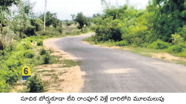
సూచిక బోర్డుకూడా లేని రాంపూర్ వెళ్లే దారిలోని మూలమలుపు

వందలాది మంది వ్యాపారులు ద్వీపక వాహనాలు, ప్రయాణికులు అటోలు, ఆర్టీసీ బస్సులు ఈ ప్రాంతం గుండా సదుపాయాలు. ఒక వాహనం వస్తుందంటే ఆ వాహనం పోయేవరకు ఎక్కడో ఓ దగ్గర స్టాంపు చూసుకుని ఎదురుగా వచ్చే వాహనం వెళ్లేవరకు నిలపాలిస్తే. లేకుంటే ప్రమాదం జరగడం ఖాయం. ద్వీపక వాహనాలు, అటోలకు ప్రమాదాలు మాత్రం తప్పక ఉంటుంది. ప్రస్తుత కాంగ్రెస్ ప్రభుత్వం రోజూ ఆ దారి గుండా వెళ్తున్న ప్రజలు, వ్యాపారులకు ప్రమాదాలు జరుగుతున్నాయి. పెరిగిన చెట్ల పాదలను తొలగించాల్సిన అవసరం ఉంది.