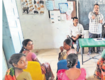
కోనాపూర్ ప్రభుత్వ పాఠశాలలో తల్లిదండ్రుల కమిటీ సమావేశం