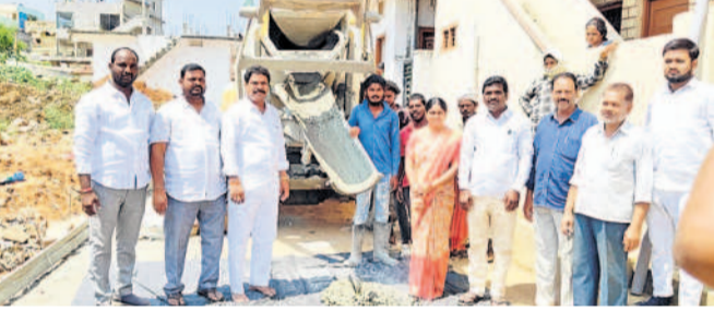
నర్సాపూర్, జూన్ 16: మున్సిపాలిటీలోని రోడ్డు నిర్మాణ పనులను పరిశీలించారు. పనుల్లో లోపం ఉన్న కొన్ని చోట్లను తనిఖీ చేశారు.