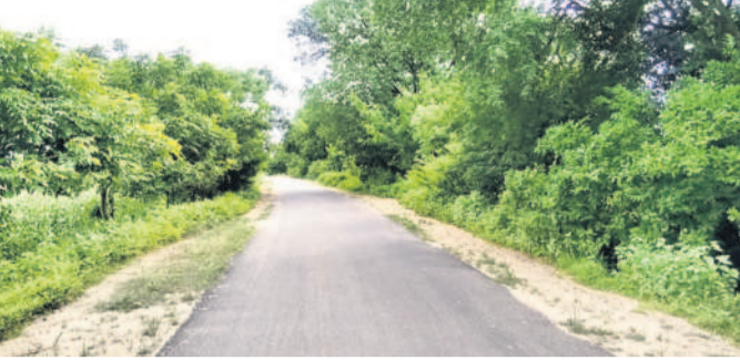
నన్యల్ నుంచి నిజాంపేట వెళ్లే రోడ్డులో చెట్లు పెరగడంతో కానరాని మూలమలుపు