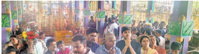
కూకట్లలో భక్తుల సందడి

పాపస్వేదీ, జూన్ 16: ఏడుపాయల వన దుర్గాదేవీ మాతను ఆదివారం పెద్ద ఎత్తున భక్తులు దర్శించుకుని పూజలు చేశారు.