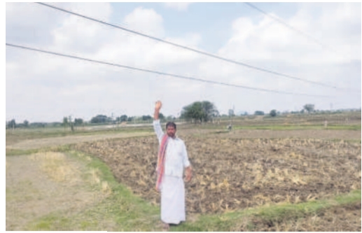
పాతూరులో వేళాడుతున్న విద్యుత్ తీగలు చూపిస్తున్న రైతు