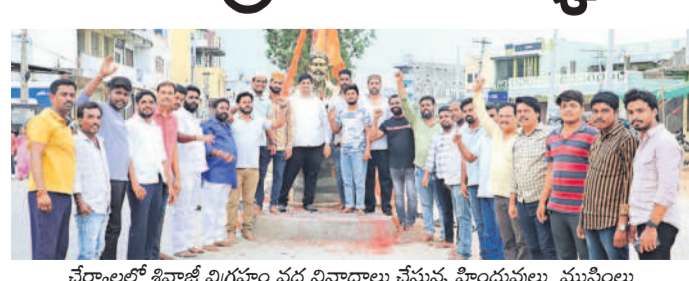
చేర్యాలలో శివాజీ విగ్రహం వద్ద నివాసాలు చేస్తున్న హిందువులు, ముస్లింలు

చేర్యాల, జూన్ 16: సిద్దిపేట జిల్లా చేర్యాల పట్టణంలోని వీరభద్ర సినిమా లాకీని ప్రాంతంలోని పాత పిల్లలబంక ఎదురుగా రాత్రికి రాత్రి శివాజీ విగ్రహం ఏర్పాటు చేశారు. చేర్యాల పట్టణంలోని జాతీయ రహదారి రోడ్డు దివెడల్ మధ్య శనివారం రాత్రి వరకు శివాజీ విగ్రహాలు లేవు. తీరా ఆదివారం శివాజీ విగ్రహం దర్శనమిస్తుండంతో స్థానికులు ఆత్మకార్యాలికి తోడ్పడ్డారు. విగ్రహ ఏర్పాటుకు ముందుగా ఆనుమతులు తీసుకోవాల్సి ఉంటుంది. కానీ, ఇక్కడ రాత్రికి