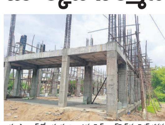
హుస్సాబాద్ లో ఆసంపూర్ణంగా ఉన్న వెజ్, నాన్ వెజ్ మార్కెట్ భవనం