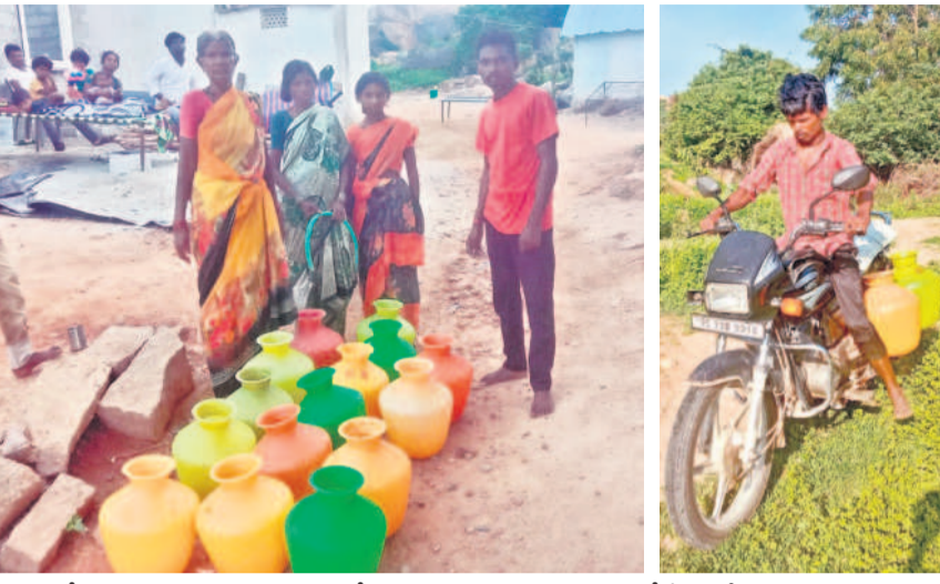
క్యూలో బిందెలు ఉంచిన గ్రామస్థులు, బోరుబావి వద్ద నుంచి బైక్ పై బిందెల్లో నీటిని తీసుకొస్తున్న యువకుడు