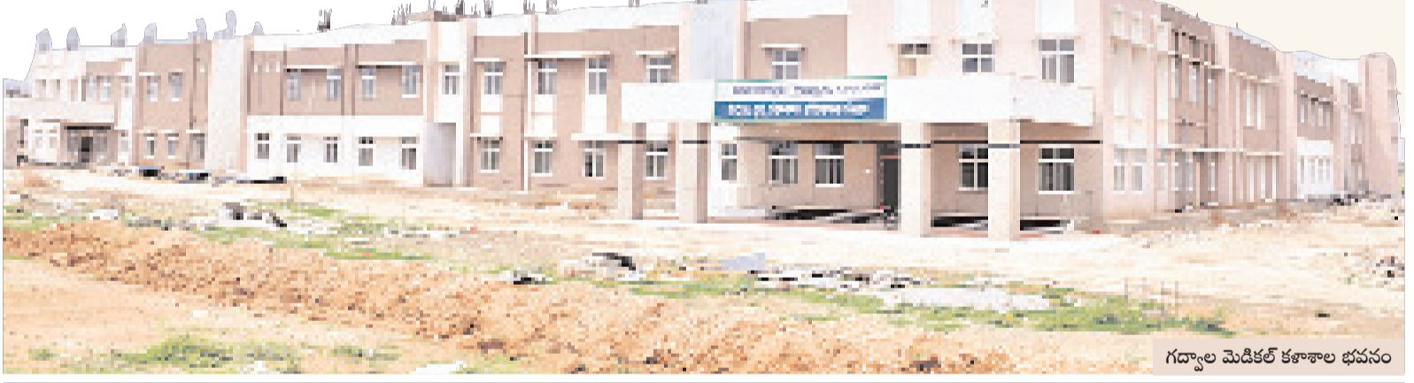
గద్యాల మెడికల్ కళాశాల భవనం

ఈ ఏడాది అందుబాటులోకి.. జోగులూరి గద్యాల విద్యార్థులకు 2024-25 విద్యా సంవత్సరంలో మెడికల్ కళాశాల అందుబాటులోకి రానున్నది. ఒక్కో కళాశాలలో 100 ఎంబీబీఎస్ సీట్లతో తరగతులు ప్రారంభించాలా ప్రభుత్వం తరఫున చేపట్టింది. కాగా సీట్ల సంఖ్యపై కొంత స్పష్టత రావాల్సి ఉన్నది. కొత్త కళాశాలలో మోతీ నడుపాలయ్య, పడకల సంఖ్యను జాతీయ మెడికల్ కలెక్షన్ పరిశీలింపాలి ఉంది. ఎన్ఎస్ఐ నిబంధనల ప్రకారం ఎంబీబీఎస్ సీట్లకు అనుమతి రావాలంటే ప్రతి కళాశాలలో 21 స్పెషలైజేషన్స్ ని విభాగాలు ఉండాలి. పడకల ఆక్యుపెన్సీ ఏటా కనీసం 80శాతం ఉండాలి. 50 సీట్లకు 220 పడకలు, 100సీట్లకు 420 పడకలు ఉండాలి. దీనిని బట్టి కళాశాలను సీట్ల కేటాయింపు చేస్తారు.