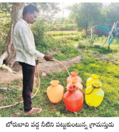
బోరుబావి వద్ద నీటిని పట్టుకుంటున్న గ్రామస్థుడు

ధరూరు, జూన్ 16 : తెలంగాణ రాష్ట్రం ఏర్పాటు యాత్ర బీఆర్ఎస్ ప్రభుత్వం అత్యంత ప్రతిష్టాత్మకంగా చేపట్టిన ముప్పై భగీరథ పథకం లక్ష్యం నీరుగాతున్నది. మండలంలోని కొత్తపాలెంలో మూడు నెలలుగా తాగునీటి సమస్య ఉన్నా అధికారులు పట్టించుకోవడం లేదని గ్రామస్థులు ఆవేదన వ్యక్తం చేస్తున్నారు. ప్రజావాణిలో ఫిర్యాదు చేసినా ఫలితం లేకపోయిందని నాపోతున్నారు. ప్రధానంగా బీసీ కాలనీలో తాగునీటి సమస్యపై సోషల్ మీడియాలో పోస్ట్ చేసినా స్పందన కరువయ్యారు. ప్రజాపాలన అంటే ఇదేనా? మేమే మరచిపోతుంటే చూడకపోతే అని ప్రశ్నిస్తున్నారు. లైన్ మెన్ పోస్ట్ చేస్తే వాటర్ మెన్ పేరు చెబుతున్నాడని.. ల్యాండ్లోకి నీళ్లు ఎక్కించడం ఇబ్బందవుతుందని పంచాయతీ కార్యదర్శి అంటున్నాడని వాపోయారు. తాగునీటి కోసం బోరు బావుల వద్దకు పోవాల్సిందేనా? అని నిలదీస్తున్నారు.