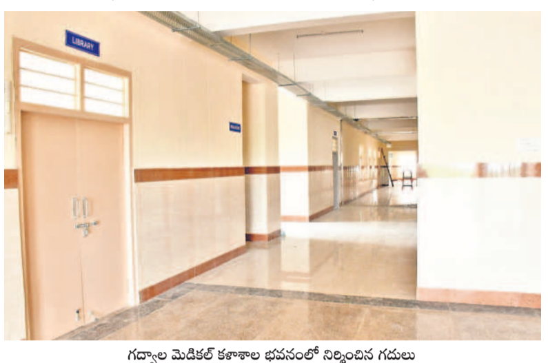
గద్యాల మెడికల్ కళాశాల భవనంలో నిర్మించిన గదులు