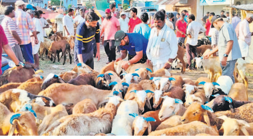
మహబూబ్ నగర్ జిల్లా కేంద్రంలో పాట్లకోట కొనుగోలు చేస్తున్న ముస్లింలు

టీటీ డ్యాంకు.. టీటీ డ్యాంకు ఇన్ ఫ్లో 1,520 క్యూసెక్కులు ఉండగా, అవుట్ ఫ్లో 301 క్యూసెక్కులుగా నమోదైంది. డ్యాంంలో 1,633 అడుగుల పూర్తిస్థాయి నీటిమట్టానికి గానూ ప్రస్తుతం 1,583.03 అడుగులకు చేరినట్లు డ్యాంం సెక్షన్ అధికారి రామచంద్ర తెలిపారు.