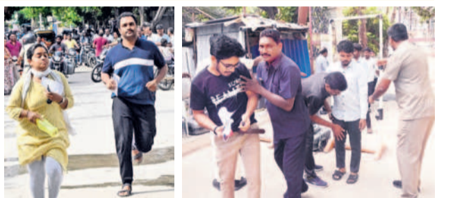
నమయం కావడంతో పరుగున వస్తున్న అభ్యర్థులు