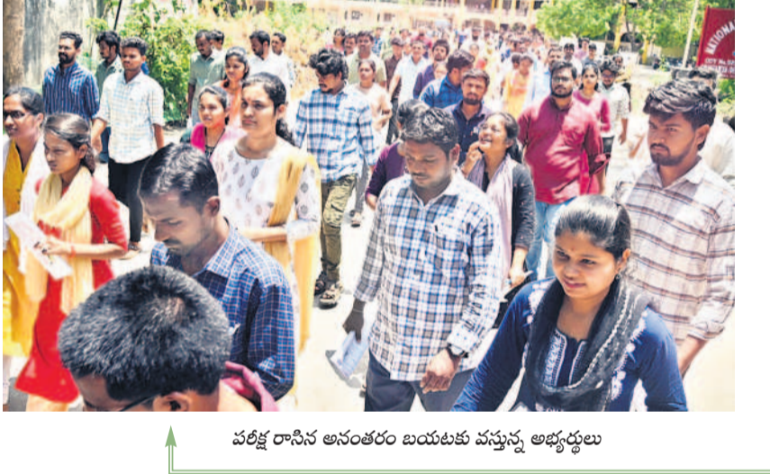
పరీక్ష రాసిన అనంతరం బయటకు వస్తున్న అభ్యర్థులు

వైతన్య డిగ్రీ కళాశాల వద్ద అభ్యర్థులను తనిఖీ చేస్తున్న పోలీసులు