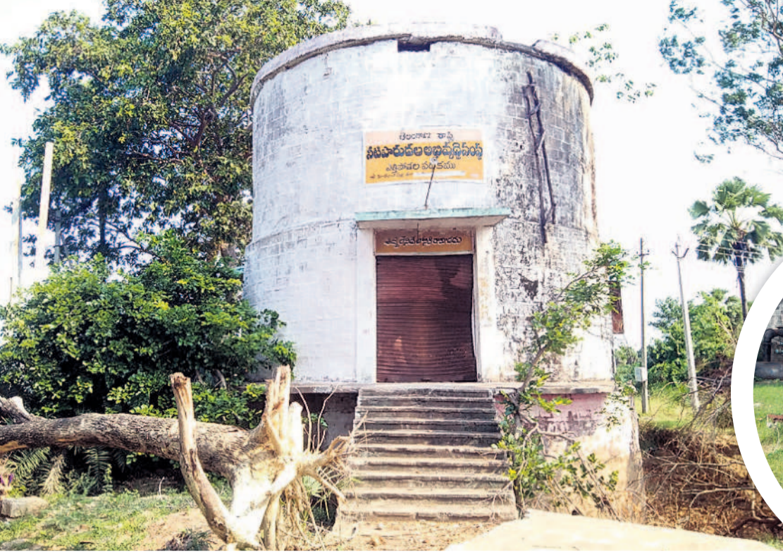
జయశంకర్ భూపాలపల్లి జిల్లాలోని మోరంపల్లి ఎత్తిపోతల ప్రాజెక్టు