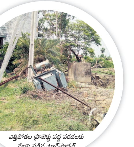
ఎత్తిపోతల ప్రాజెక్టు వద్ద వరదలకు నేలపై పడిన ట్రాన్స్ఫార్మర్