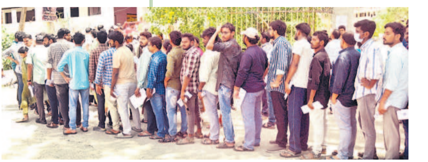
హనుమకొండలోని వైతన్య డిగ్రీ కళాశాలలో సివిల్స్ పరీక్ష రాయడానికి బారులు తీరిన అభ్యర్థులు