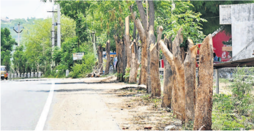
సిద్దిపేట నుంచి అనంతపాగర్ వరకు రాజీవ్ రహదారిపై హరితహారం చెట్లను నరికివేయడంతో కనిపిస్తున్న మొండెలు