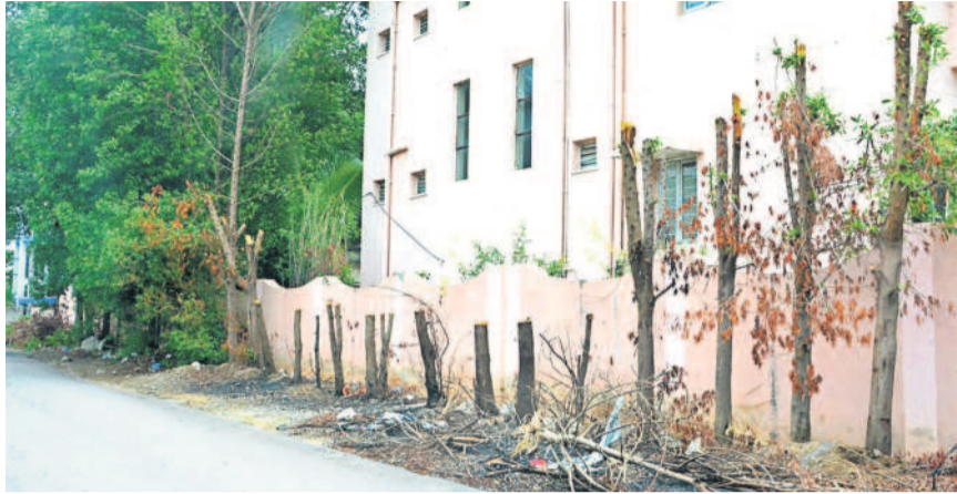
సంగారెడ్డి పట్టణంలో హరితహారం చెట్లను నరికివేసిన దృశ్యం