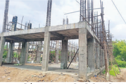
హుస్సాబాద్ లో ఆసంపూర్తిగా ఉన్న వెజ్, నాన్ వెజ్ మార్కెట్ భవనం