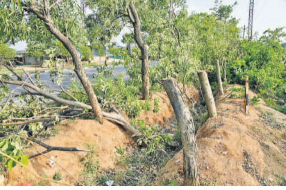
సిద్దిపేట జిల్లా ములుగు మండలం వంటిమామిడి వద్ద రాజీవ్ రహదారి వెంట హరితహారంలో నాటిన చెట్లను నరికివేసిన దృశ్యం