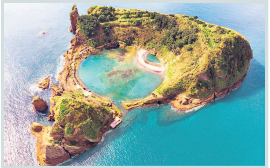
లిస్ట్ నీ తీరానికి 900 మైళ్ల దూరంలో ఉన్న ఈ ద్వీప సమూహం ప్రకృతికి ఆలవాలం. పోర్చుగల్ దేశ పరిధిలో అట్లాంటిక్ జలధిలో పరుచుకున్న అజోన్ ద్వీపం నింగి నుంచి జారిిన పచ్చలపేరులా ఉంటుంది.