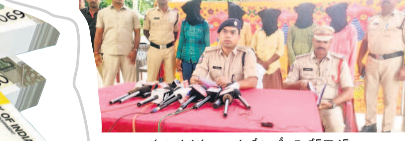
మాట్లాడుతున్న నారాయణపేట ఎస్పీ యోగేష్ గౌతమ్

ఒకేసారి చెల్లిస్తే 20 శాతం డిస్కాంట్.. ప్రైవేట్ పాఠశాలలో ఫీజు డిస్కాంట్ అఫర్ కూడా నడుస్తున్నది. ఫీజు మొత్తం ఒకేసారి చెల్లిస్తే 20 శాతం డిస్కాంట్.. మూడు విడుదల చెల్లిస్తే 15 శాతం డిస్కాంట్ ఇవ్వాలని లెక్కలేని మరీ చెబుతున్నారు. ఉదాహరణకు రెండో తరగతి ఫీజు రూ.92వేలు అనుకుంటే.. మూడు విడుదలతో చెల్లిస్తే 15 శాతం డిస్కాంట్ అంటే రూ.4,800 డిస్కాంట్ పోనూ రూ.27,200 చెల్లిస్తే మొత్తం ఒకేసారి చెల్లిస్తే 20 శాతం అంటే రూ.6,400 డిస్కాంట్ పోనూ రూ.25,600 చెల్లిస్తే.. అంటూ విద్యార్థుల తల్లిదండ్రులకు బంపి అఫర్లు ఇస్తున్నారు.