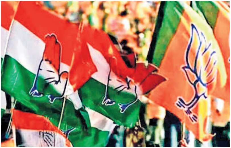
ముఖ్యమైన అంశాలు. 303 సీట్లు వచ్చిన మోదీ 240 డగ్గర ఎందుకు ఆగాడు? ప్రజల మనస్సుల్లో ఏముంది? ఎందుకు ఆగాడంటే, మోదీకి, బీజేపీకి మాడింది! ప్రజాభిమానం, మతపిచ్చి పోయాలు. మరీ 52 వచ్చిన కాంగ్రెస్ 99 తప్పుకుంది. అంటే ప్రజాభిమానం ఆ పార్టీకి పెరిగిందా? నిజానికి అభిమానం పెరిగి కాదు.

3 కేంద్ర పరిస్థితి! తమ బీజేపీ తరపున 250 సీట్లు తెచ్చుకుంటే ఇంకొక 150 అయోధ్యలో తమ చెయ్యి పట్టుకొని తీసుకెళ్లిన బాలారాముడు తెచ్చి పెడతాడు, 400 గెలుస్తామని అహంకరించిన సరేంద్ర మోదీ మెజారిటీ కూడా సాధించలేకపోవటం ఎందుకు? ఇది ఎవరైనా ఆలోచిస్తున్నారా? మోదీ ఉంటాడా? ఊడతాడా? చంద్రబాబు అమరావతిని ఇంకొక పదేండ్లలో కట్టేస్తాడా? ఎన్నికల మూర్ఖుడే అక్కడ ఎకరం 50 లక్షలందిన ఆంధ్రజ్యోతి రాసేస్తే నమ్మే దామా? ఇవేనా ఈ మేధావులు మాట్లాడవలసిన మాటలు?