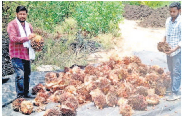
మొక్కనుంచి కోసిన గెలలును చూపుతున్న రైతులు