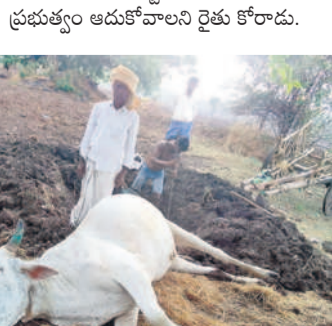
మృతి చెందిన ఎద్దు