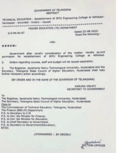
ఆదిలాబాద్ కు జీఎన్టీయూ కళాశాల మంజూరు చేస్తూ

ఆదిలాబాద్, జూన్ 15 (నమస్తే తెలంగాణ) : ఉమ్మడి ఆంధ్రప్రదేశ్ లో వేద విద్యార్థులకు సర్కారు చదువులు అందిస్తూ మారాయి. ప్రత్యేక రాష్ట్రం ఏర్పడిన తర్వాత కేసీఆర్ సర్కారు పదేళ్ల పాటునే వేద విద్యార్థుల బంగారు భవిష్యత్తుకు బాటలు వేసింది. కేజీ సుచి వీజీ పరకు ఉచిత విద్యను అమలు చేయడంతో పాటు ప్రతి జిల్లాకూ మెడికల్ కళాశాలలు మంజూరు చేసింది. రెసిడెన్షియల్ స్కూళ్లలో వేద విద్యార్థులకు ఉచితంగా ఇంగ్లీషు మీడియం, కార్పొరేట్ స్టాయిల్ విద్య, పాస్టికాఫరం, పనులు అందజేసింది. దీంతో విద్యార్థులు గురుకుల పాఠశాలలో చేరడానికి పోటీ పడ్డారు. ఈ మేరకు ఇంజనీరింగ్ విద్యార్థులు ఆదిలాబాద్ జిల్లాలోనే ఉపాధి పొందితా అటెన్షన్ ప్రభుత్వం చర్యలు తీసుకున్నది. ఇందులో భాగంగా రెండు ఐటీ కంపెనీలను ఏర్పాటు చేయడంతో పాటు రూ.40 కోట్లతో ఐటీ పటను నిర్మించింది. జీఎన్టీయూ సర్కారు అందించిన సహకారంతో యువత స్థానికంగా ఉన్నత ఉద్యోగాలు చేసే అవకాశం లభించింది. రెండు కంపెనీల్లో 280 మంది ఉద్యోగాలు చేస్తున్నారు.