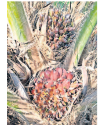
ఆయిల్ పామ్ మొక్కల వ్యాపక గెలలు

● మొదటి విడుదలలో సాగైన పంట కోతకు ● దిలావర్ పూర్ మండలం గుండంపెల్లిలో 15 ఎకరాల్లో దిగుబడి ● మార్కెట్లో టన్నుకు రూ.13,200 ధర