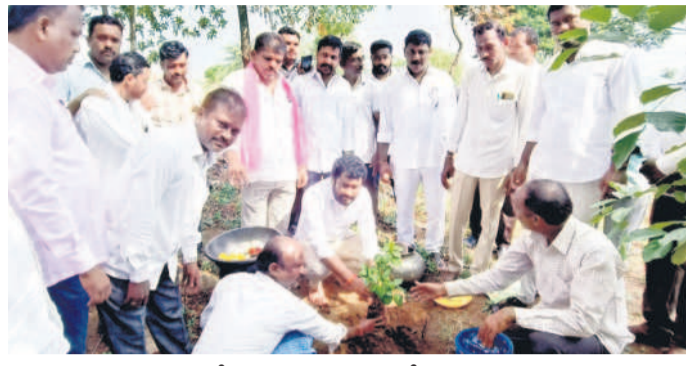
కుప్పలో మొక్కలును, ఎమ్మెల్యే జాడవ అనిల్