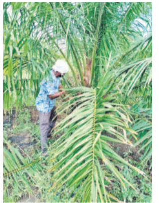
గుండంపెల్లిలో గెలలును కోస్తు..

నిర్మల్, జూన్ 14(నమస్తే తెలంగాణ): రైతులను లాభాల బాట పట్టించడమే కాకుండా, ప్రత్యామ్నాయ సాగు వైపు దృష్టి సారించేందుకు గత కేసీఆర్ ప్రభుత్వం ఆయిల్ పామ్ సాగును ఎంతో ప్రోత్సహించింది. ఆయిల్ పామ్ సాగుకు ముందుకు వచ్చిన రైతులకు అనేక సబ్సిడీలతో పాటు డ్రైవ్ ఇరిగేషన్ సదుపాయాన్ని కల్పించింది. నాలుగేళ్ల పాటు పంట నిర్వహణ, ఎరువుల కోసం ఎకరానికి రూ.4200 చొప్పున అందించింది. జిల్లా రైతులకు అందుబాటులో ఉంచేందుకు సారంగాపూర్ మండలం బీరవెల్లి వద్ద పెద్ద అక్షయ సర్కి బీని ఏర్పాటు చేసి ఆయిల్ పామ్ మొక్కలను పెంచారు. రూ.200 విలువైన మొక్కలు రూ.180 సబ్సిడీ ఇచ్చి కేటం రూ.20కి రైతులకు అందించారు. నిర్మల్ జిల్లాలో పెద్ద సంఖ్యలో రైతులు ఆయిల్ పామ్ తోటలను