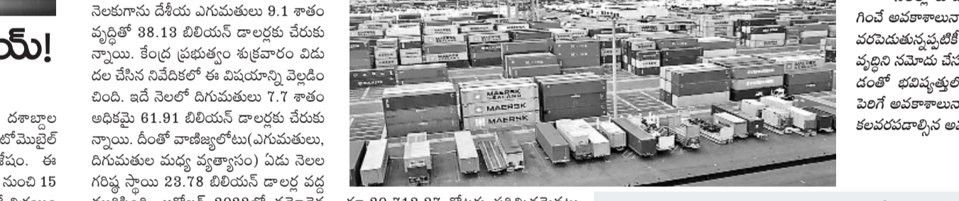
గత నెలలో 23.78 బిలియన్ డాలర్లుగా నమోదు

గత నెలలో 23.78 బిలియన్ డాలర్లుగా నమోదు సూర్యాపేట, జూన్ 14: గత కొన్ని నెలలుగా రెండవ నెల స్థాయిలో వృద్ధిని కనబరిచిన దేశీయ ఎగుమతులు మళ్ళీ నీరసించాయి. గత నెలకుగాను దేశీయ ఎగుమతులు 9.1 శాతం వృద్ధితో 38.18 బిలియన్ డాలర్లకు చేరుకున్నాయి. కేంద్ర ప్రభుత్వం శుభ్రవారం విడుదల చేసిన నివేదికలో ఈ విషయాన్ని వెల్లడించింది. ఇదే నెలలో దిగుమతులు 7.7 శాతం అధికమై 61.91 బిలియన్ డాలర్లకు చేరుకున్నాయి. దీంతో వాణిజ్యోటు(ఎగుమతులు, దిగుమతుల మధ్య వ్యత్యాసం) ఏడు నెలల గరిష్ఠ స్థాయి 23.78 బిలియన్ డాలర్ల వద్ద ముగిసింది. అక్టోబర్ 2023లో నమోదైన 31.46 బిలియన్ డాలర్ల వాణిజ్య లోటు కారణం ఇదే గరిష్ఠ స్థాయి కావడం విశేషం. ఇంజనీరింగ్, ఎలక్ట్రానిక్స్, పారిశ్రామికీకర్త, కర్మాగారాలు, ప్లాస్టిక్ రంగాలు ఆజానీత పనితీరు కనబరచడం వల్లనే ఎగుమతుల్లో ఈ మాత్రమైన వృద్ధిని సాధించాయి.