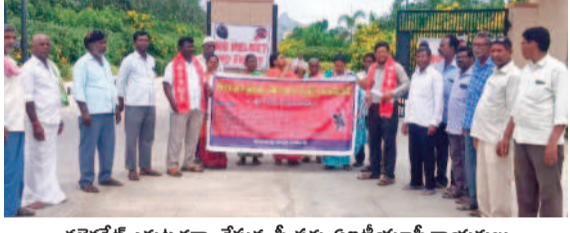
కలెక్టరేట్ ఎదుట దర్శనం చేస్తున్న స్వీపర్లు, వివేచియానీ నాయకులు

వనపర్తి, జూన్ 14 : జిల్లాలోని ప్రభుత్వ పాఠశాలలో పనిచేస్తున్న స్వీపర్లకు రెండు రకాల జీతాలు అమలుచేస్తూ శ్రమదోషి పిడి గిరిచేస్తున్నారని వివేచియానీ జిల్లా కార్యదర్శి మోష అరోపించారు. స్వీపర్ల జీతాలలో తేడాలు సరిచేసి వారికి న్యాయం చేయాలని డిమాండ్ చేస్తూ శుభ్రవారం కలెక్టరేట్ ఎదుట వివేచియానీ అధ్యక్షుల దర్శనం చేపట్టారు. ఈ సందర్భంగా వారు మాట్లాడుతూ ప్రభుత్వ పాఠశాలలో పనిచేస్తున్న స్వీపర్లకు వేతనాలున్నవని, సుప్రీంకోర్టు తీర్పును పుష్కలంగా అమలు చేయడం అమానుషమన్నారు. చాలీచాలని జీతాలతో స్వీపర్లు అత్యంత దుర్భర జీవితాలను గడుపుతున్నారని ఆవేదన వ్యక్తం చేశారు. స్వీపర్లను ప్రభుత్వ ఉద్యోగులుగా గుర్తించి ప్యాక్షన్ నిబంధనలను తొలగించాలని