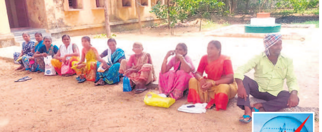
ఖానాపూరు మండల పరిషత్ కార్యాలయంలో బారులు తీరిన గృహజ్యోతి లబ్ధిదారులు