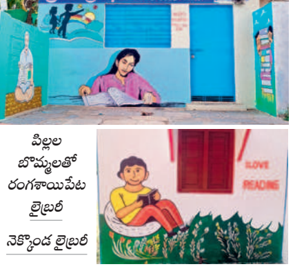
రంగాయపేట లైబ్రరీ గోడలపై వేసిన మోడల్ పిక్చర్లయల్ పెయింటింగ్