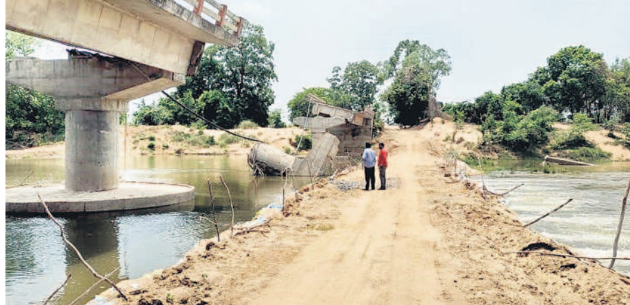
కూలిన బ్రష్టి పక్కనే మేడారం జాతర సమయంలో తాత్కాలికంగా నిర్మించిన రోడ్డు

ఏటూరునాగరం, జూన్ 13 : వానోస్తుండటేనే ఆ రెండు గ్రామాల్లో ప్రజల్లో భయం మొదలవుతుంది. వరద భారీగా వస్తే రాకపోకలు నిలిచిపోవడమే గాక గతేడాది లాగే వరద గ్రామాన్ని ముంచెత్తితే తమ పరిస్థితి ఏంటని ఆందోళన వెంటాడుతున్నది. వివరాలిలా ఉన్నాయి. జంపన్నవారుపై ఏటూరునాగరం మండలం దొడ్ల సమీపంలో నిర్మించిన బ్రష్టి గతేడాది భారీ వరదలకు కొట్టుకుపోయింది. దీంతో కొండాయి గ్రామం పూర్తిగా మునిగిపోవడంతో మల్యాల-కొండాయికు రవాణా స్తంభించింది. మేడారం జాతర సందర్భంగా ప్రైవేట్ వాహనాలను చిన్నబోయిసపల్లి నుంచి ఊరట్లం వరకు మళ్లించేందుకు వారుపై తాత్కాలికంగా రూ. 20 లక్షలతో డైవర్లను రోడ్డు వేయగా వాహనాల రాకపోకలు కొనసాగుతున్నాయి. కాగా, ఇటీవలి వర్షానికి మళ్లీ వారులోకి వచ్చిన వరదతో రోడ్డు చివరకు కోతకు గురయ్యాయి. నీటి ప్రవాహానికి మళ్లీ కొట్టుకుపోవడం డాగా, రోడ్డుపై ఒకచోట చిన్నపాటి గొయ్యి ఏర్పడింది. ఇక భారీగా వరదొస్తే డైవర్లను రోడ్డు కూడా కొట్టుకుపోయే ప్రమాదం ఉంది. అలాగే కొండాయి మునిగిపోతుందని, రవాణా పోకర్లం నిలిచిపోతుందనే భయం గ్రామస్థుల్లో నెల