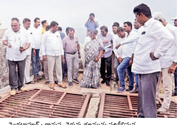
వెంకటాపూర్ : రామప్ప చెరువు తూమును పరిశీలిస్తున్న మంత్రి సీతక్క, కలెక్టర్ ఇలా త్రిపాటి, అధికారులు

ములుగు, జూన్ 13 (నమస్తే తెలంగాణ) : జిల్లాలో వచ్చిన అధికారులు బాధ్యతగా పనిచేయాలని, విషయల్లో నిర్లక్ష్యం వహిస్తే సహించేది లేదని పంచాయతీరాజ్ శాఖ మంత్రి సీతక్క హెచ్చరించారు. గత కొద్ది రోజులుగా అధికారులు అవలంబిస్తున్న విధానాలపై ఆమె ఆగ్రహం వ్యక్తం చేశారు. ఇక్కడ పనిచేయడం కష్టంగా అనిపిస్తే బదిలీ చేసుకొని వెళ్లాలని సూచించారు. గురువారం కలెక్టరేట్లో కలెక్టర్ ఇలా త్రిపాటి అధ్యక్షతన నిర్వహించిన వరద సంస్కరణ సమీక్షలో మంత్రి పాల్గొన్నారు. ఈ సందర్భంగా సీతక్క ముట్టూరుకూడా వానకాలంలో అధికారులు సమన్వయంతో పనిచేయాలన్నారు. ముంపు ప్రాంతాల నివారణకు శాశ్వత ప్రాతిపదికన ప్రణాళికలు సిద్ధం చేయాలని ఆదేశించారు. గ్రామాల్లో పరిశ్రమ ప్రాధాన్యం ఇస్తూ స్వచ్ఛ గ్రామాలగా తీర్చిదిద్దాలన్నారు. గురువారం సాయంత్రం పాలంపేటలో కొనసాగుతున్న ప్రసాద్ సీమే పనులను, రామప్ప చెరువు కట్టను, తూములను, కాల్యాణం, మత్తే ప్రదేశాన్ని ములుగు కలెక్టర్ ఇలా త్రిపాటి, అధికారులతో కలిసి ఆమె పరిశీలించారు. పనులను త్వరగా పూర్తి చేయాలని, అలయ తూర్పు రహదారి ఎదురుగా పడకరాల స్టంట్ రూ. 61.99 కోట్లతో పుట్ల కోడ్లు, ఇంటర్ప్రిటిషన్ నింట్ల తదితర పనులు చేపడుతున్నట్లు తెలిపారు. ఆ తర్వాత రామప్ప సరస్సును సందర్శించి నీటి నిల్వ సామర్థ్యం, అయకట్టు వివరాలను అడిగి తెలుసుకున్నారు. సరస్సు మత్తేడిని పరిశీలించి వరదల