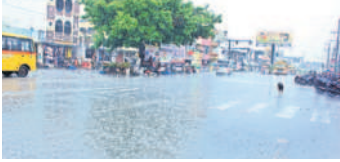
జనగామ పట్టణంలో పడుతున్న వాన