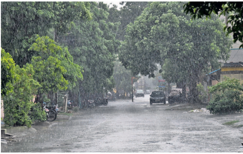
హనుమకొండలోని రెడ్డికాలనీలో కురుస్తున్న వర్షం