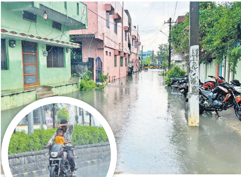
నర్సంపేటలో కాలనీల్లోకి చేరిన వరద నీరు హనుమకొండ కేయూ రోడ్లో..