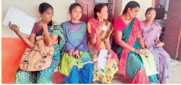
వాణిపేట : ఎంపీడీవో కార్యాలయం వద్ద దరఖాస్తుల సవరణ కోసం వచ్చిన లబ్ధిదారులు

గృహజ్యోతి కోసం పడిగాపులు మొరాయిచిన ఆన్లైన్ సిర్కర్.. ఖానాపూరు/వాణిపేట, జూన్ 13 : రాష్ట్ర ప్రభుత్వం ప్రతిష్టాత్మకంగా చేపట్టిన గృహజ్యోతి పథకం అమలుకు నోచుకోక అర్హతైన లబ్ధిదారులకు కష్టాలు తప్పడంలేదు. తెల్లరేపన కార్యదారులకు 200 యూనిట్లలోపు ఉచిత విద్యుత్ అందించేందుకు ప్రజాపాలన గ్రామపంచాయతీ దరఖాస్తులను స్వీకరించింది. క్షేత్రస్థాయిలో విద్యుత్ సిబ్బంది సర్కే చేసి అర్హతను గుర్తించి ఉచిత బిల్లులు అందజేశారు. అయితే చాలా మంది దరఖాస్తుల్లో తప్పులుండడంతో వాటిని సరిదిద్దేందుకు ఎంపీడీవో కార్యాలయాల్లో ప్రత్యేక కౌంటర్లను ఏర్పాటు చేసింది. ఈ క్రమంలో పార్లమెంట్ ఎన్నికల