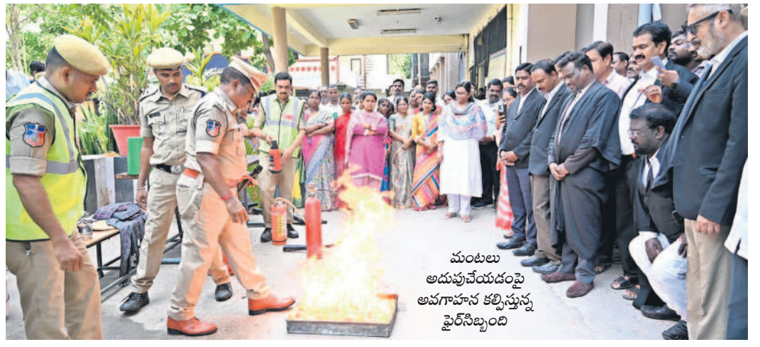
మంటలు అదుపుచేయడంపై అవగాహన కల్పిస్తున్న పైలెట్ ఆఫీసర్