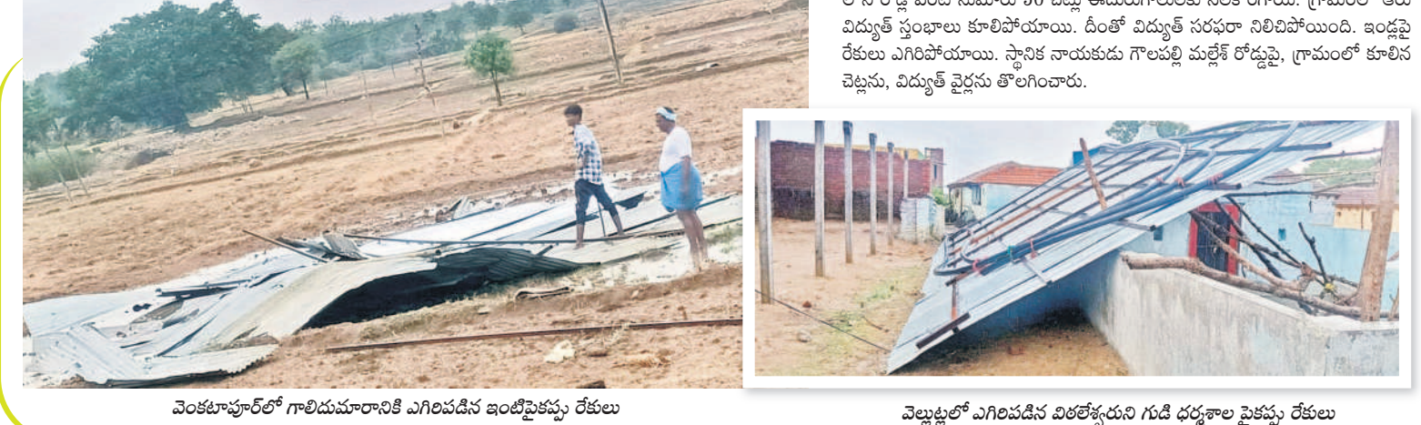
వెంకటాచార్య గాలిదుమారానికి ఎగిరిపడిన ఇంటిపైకప్పు రేకులు వెల్లుబ్బలే ఎగిరిపడిన విద్యార్థులను గుడ్డి ధర్మాలు పైకప్పు రేకులు