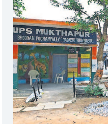
భూదాని పోచంపల్లి మండలం ముక్తాపూర్లో అసంపూర్తిగా గది నిర్మాణం పనులు

పెట్టా ఒక్క పాఠశాలలో కూడా పనులు పూర్తి కాలేదు. ముక్తా పూర్తిలో అసంపూర్తిగా గది నిర్మాణం పనులు కొనసాగుతున్నాయి. బుధవారం పాఠశాలలు ప్రారంభం కాగా సమస్యలతో విద్యార్థులు ఇబ్బందులు ఎదుర్కొన్నారు.