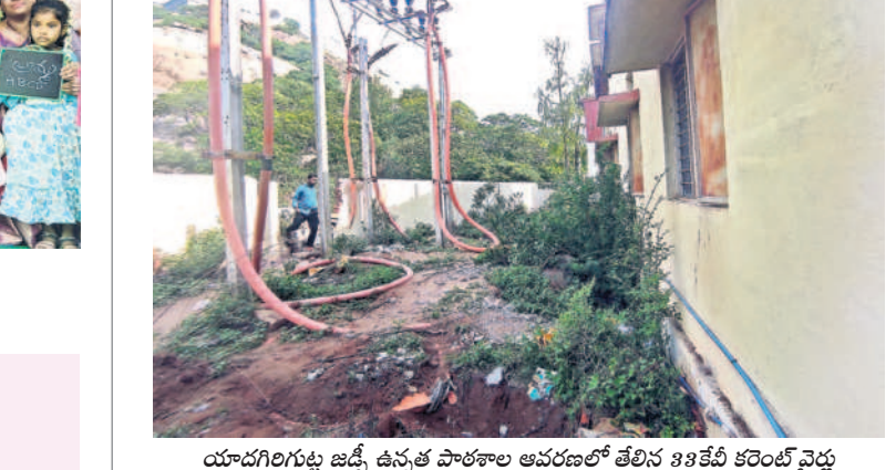
యాదగిరిగుట్ట జడ్చి ఉన్న పాఠశాల ఆవరణలో తేలిక 33కేబి కరెంట్ వైర్లు

గుట్ట ప్రభుత్వ పాఠశాల ఆవరణలో ప్రమాదకరంగా 33కేబి విద్యుత్ తీగలు