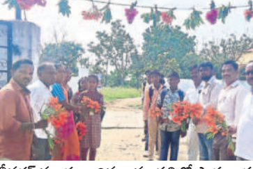
బీబీనగర్ మండలం చిన్నరావుపల్లిలో పాఠశాలకు వచ్చిన విద్యార్థులకు పూలు అందజేసి స్వాగతం పలుకుతున్న ప్రభుత్వ పాఠశాల ఉపాధ్యాయులు

కెళ్ల పాఠశాల దగ్గర దింపడం వంటి పనులతో తల్లిదండ్రులు తీరికలేకుండా గడిపారు. పిల్లలు కూడా ఫస్ట్ డే కావడంతో ఎంతో ఉత్సాహంతో పాఠశాలకు తరలివెళ్లారు. విద్యార్థులకు పాఠశాలల్లో అన్ని