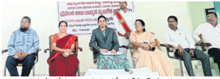
సమావేశంలో మాట్లాడుతున్న ప్రధాన సీనియర్ సీనిల్ జడ్జి వి.మాధవలత