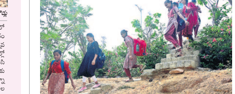
ప్రమాదకరంగా యాదగిరిగుట్టలో జడ్చి ఉన్న పాఠశాల దారి

యాదగిరిగుట్ట, జూన్ 12 : 2024-25 విద్యా సంవత్సరం ప్రారంభమైంది. రోడ్డు మార్గంలో ఇంత జరుగుతున్నా విద్యా ధ్యాయులు, ప్రజాప్రతినిధులు పునః ప్రారంభించారు. పలు పాఠశాలల్లో విద్యార్థులకు మాత్రానే ఉన్నాయి. స్కూల్ పాఠశాలలను ఎక్కోచో నగైన మెట్ల మార్గం లేకుండా పోయింది. యాదగిరిగుట్ట పట్టణంలోని పాత గోశాల వద్ద గల జిల్లా పరిషత్ ప్రభుత్వ పాఠశాల ప్రాంగణంలో విద్యుత్ తీగలు ప్రమాదకరంగా మారాయి. కొండ మండల విద్యుత్ సరఫరా చేసేందుకు పాఠశాల భవనంలోని వెనుక ప్రాంతంలో 33 కేబి వైర్లు వీలవ్వాలని ఏర్పాటు చేశారు. అందరొకటి విద్యుత్ పైపులైన్ వెయిగా అందులో కొన్ని విద్యుత్ తీగలు బయటకు వచ్చి ప్రమాదకరంగా మారాయి. ఆదమరి