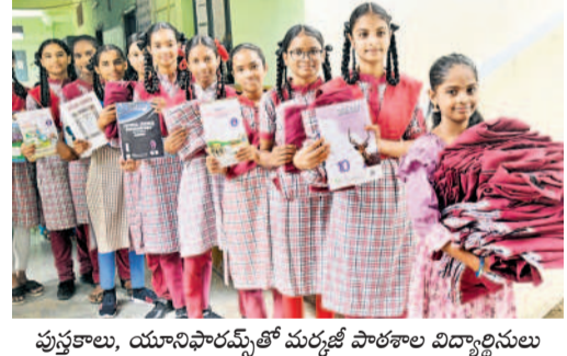
పుస్తకాలు, యూనిఫారమ్స్ తో మర్రోజు పాఠశాల విద్యార్థినులు