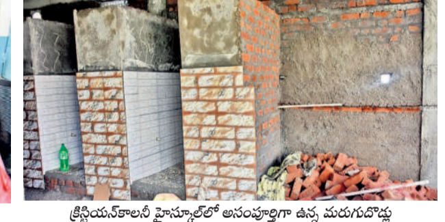
క్రీష్ణయ్యనకాలనీ హైస్కూల్లో అసంపూర్ణంగా ఉన్న మరుగుదొడ్డు

గిరిజన పాఠశాలల్లో మరమ్మతులు లేవే.. ■ అపరిశుభ్రంగా టూలులెట్స్ ■ ప్రమాద కరంగా కిటికీలు ■ పనిచేయని తాగునీటి బోర్డు ఏటూరునాగారం, జూన్ 12 : బడిబాట పరిధిలోని గిరిజన ఆశ్రమ పాఠశాలల్లో సమస్యలు నెలకొన్నాయి. కొన్ని ఆశ్రమ పాఠశాలలు, హాస్టల్స్ లో ఆర్ వో ప్యాంట్లు సరిగా పని చేయడం లేదు. టూలులెట్స్ కు నీటి సరఫరా జరగడం లేదు. కొన్ని చోట్ల తరగతి గదులకు కిటికీ తలుపులు ఊడిపోయి ప్రమాదకరంగా ఉన్నాయి. పలు చోట్ల వంటగదుల నిర్మాణం అసంపూర్ణంగా ఉంది. బడిబాట కేంద్రంగా ఉన్న ఏటూరునాగారంలోని గిరిజన బాలుర ఆశ్రమ పాఠశాలలో అనేక సమస్యలు నెలకొన్నాయి. చిన్నబోయినపల్లి ఆశ్రమ పాఠశాలలో 400 మంది విద్యార్థులకు 12 టాయిలెట్స్ ఉండగా, నాలుగు మాత్రమే పనిచేస్తున్నాయి. నీటి కోసం నాలుగు బోర్డు ఉండగా రెండు వేసవిలో చెడిపోయాయి. కన్యాశుల్కం దెంపిలోని గిరిజన ఆశ్రమ పాఠశాలలోని పై అంతస్తులోని తరగతి గదుల కిటికీలు ఊడిపోయాయి. కివెన్ షెడ్ అసంపూర్ణంగా ఉంది. పూర్తి స్థాయిలో గోడ నిర్మాణం చేపట్టలేదు. రెండు బ్లాక్ లో అరు చొప్పున టాయిలెట్స్ ఉండగా ఇందులో కొన్నింటికి తలుపులు లేవు. నీటి కెమెంట్ సరిగా పనిచేయడం లేదు. తాగునీటి బోరు మోటర్ రివేరులో ఉంది. తరగతి గదులు అధ్యాపకాంగ్గా ఉన్నాయి.