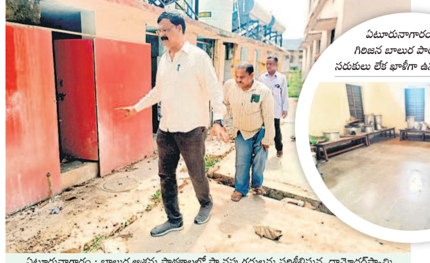
ఏటూరునాగారం : బాలుర ఆశ్రమ పాఠశాలలో స్నానపు గదులను పరిశీలిస్తున్న దామోదరస్వామి