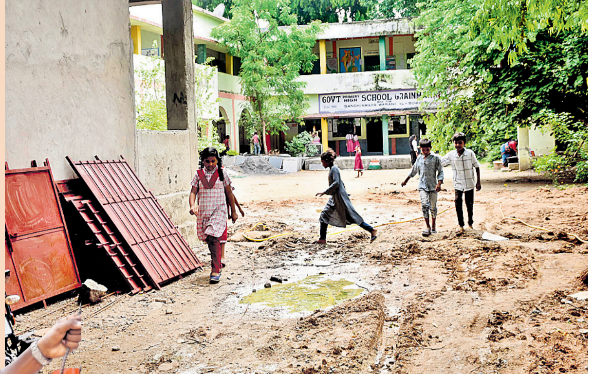
గాంధీనగర్ లోని గ్రెయిన్ మార్కెట్ పాఠశాలలో బురదను దాటుకుంటూ వెళ్తున్న విద్యార్థులు

తొలిరోజు ఉత్సాహంగా విద్యార్థుల బడిబాట పాఠ్యపుస్తకాలు, యూనిఫారాల పంపిణీ చాలాచోట్ల అధ్యాపక కనిపించిన పరిసరాలు మురుగునీరు, చెత్తాచెదారంతో తప్పని ఇబ్బందులు అపరిశుభ్రంగా మరుగుదొడ్లు, వంట గదులు నత్తనడకన పెండింగ్ నిర్మాణ పనులు