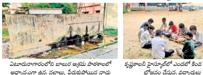
ఏటూరునాగారంలోని బాలుర ఆశ్రమ పాఠశాలలో అధ్యాపకాంగ్గా ఉన్న నల్లాలు, పేరకుపోయిన నామ