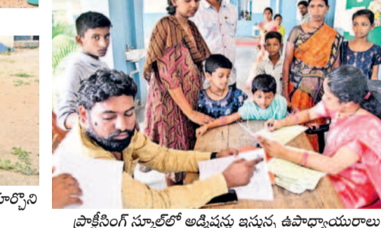
ప్రాక్షేపింగ్ స్కూల్లో అడ్మిషన్లు ఇస్తున్న ఉపాధ్యాయురాలు