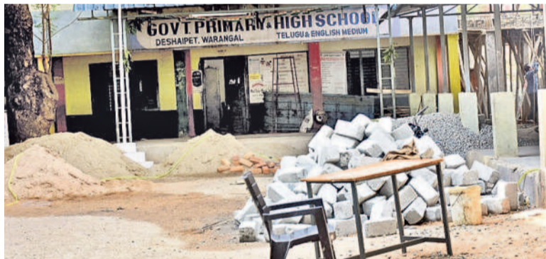
వరంగల్ దేశపాపేటి ప్రాథమిక పాఠశాలలో ఇంకా కొనసాగుతున్న పనులు