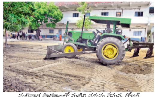
మట్టివాడ పాఠశాలలో మట్టిని చదును చేస్తున్న డోజర్