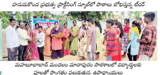
మహబూబాబాద్ మండలం మాదాపురం పాఠశాలలో విద్యార్థులకు పూలతో స్వాగతం పలుకుతున్న ఉపాధ్యాయులు