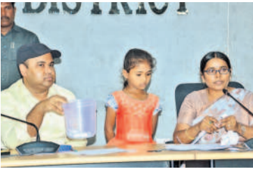
కలెక్టర్ ఆధ్వర్యంలో లక్ష్మీడివిలో ఎంపికలు