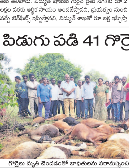
గొర్రెలు మృతి చెందడంతో బాధితులను పరామర్శించిన తహసీల్దార్, కౌన్సిలర్