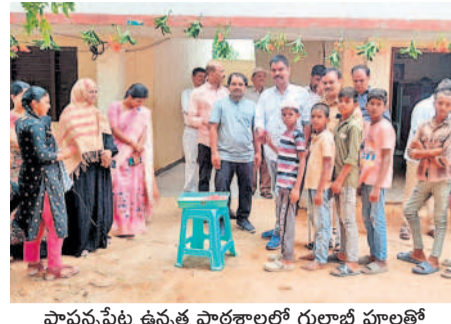
పాపన్నపేట ఉన్నత పాఠశాలలో గులాబీ పూలతో విద్యార్థులకు స్వాగతం పలుకుతున్న టీదర్శు